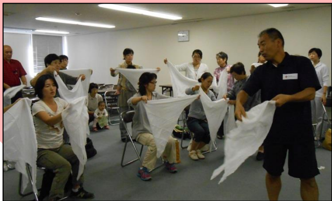
町内会館で実施された 救急法の講習会

事故の予防や応急手当等、日常生活に役立つ知識や技術、考え方を学ぶ講習会を主催しています。