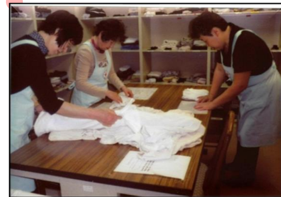
老人ホームでの奉仕活動は、平成17年から実施