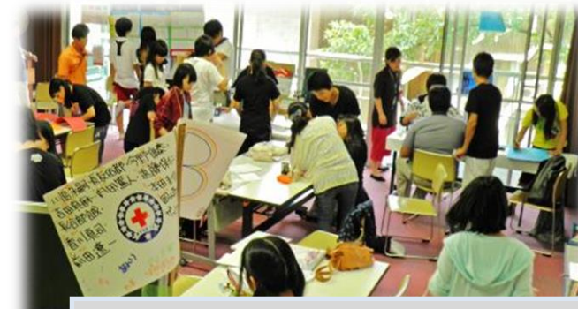
夏のリーダー育成宿泊研修(小中高、指導者)の支援をします