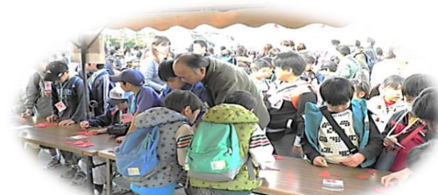
赤十字パズルに挑戦