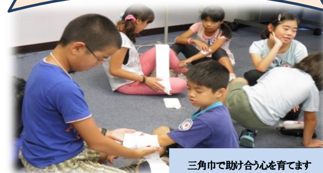
三角中で助け合う心を育てます