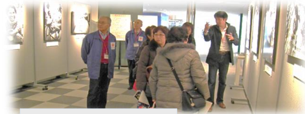
人道・地雷写真展案内