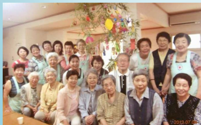
ミニデイサービス喜楽室