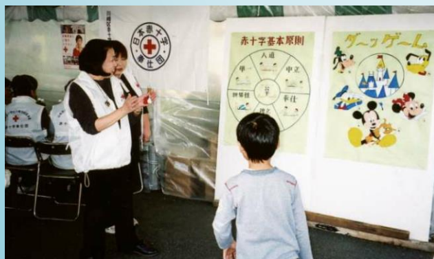
市民まつり（ダーツゲーム）