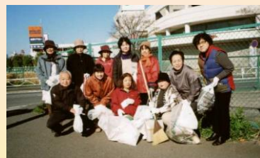
409号線道路掃除（奇数月に実施）

旭港分団は、地域に根ざす奉仕団として活動を実施しており、若手団員の入会・育成にもつとめ、奉仕団活動への関心を高めていくため努力しています。