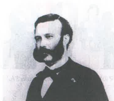
赤十字の創設者 アンリー・デュナン