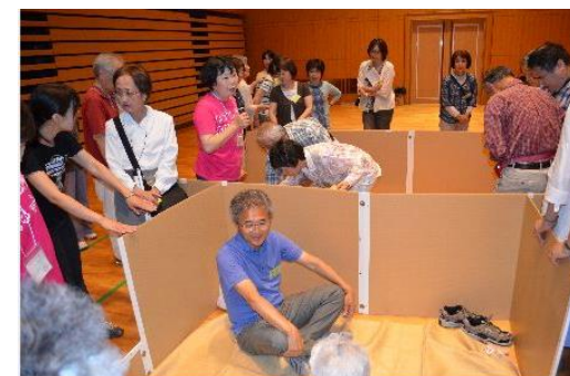
（二者懇談会 — 視障者と防災研修会）