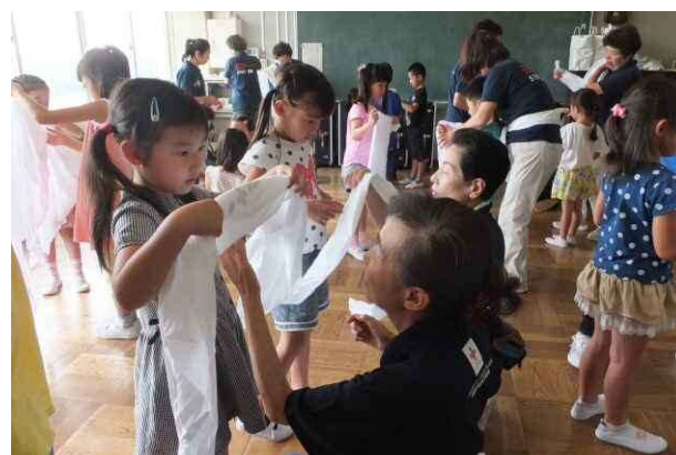
← サマースクール ～救急法・傷の手当て～

7月 日本赤十字社本社 視察研修 子育て支援事業 ～子育て支援センターすくすく講座～ 大谷・杉本小学校 サマースクール ～救急法・傷の手当て～ 海老名市子育てフェスティバル