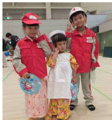
← 子育てフェスティバル 赤十字子ども服体験

今年で3回目。えびな市民まつりとの同時開催で多くの方が来場され、大変な賑わいでした。