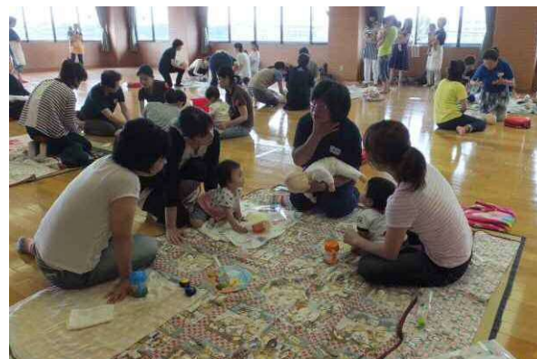
幼児安全法講習会 → ～子育て支援センター すくすく講座～

7月 日本赤十字社本社 視察研修 子育て支援事業 ～子育て支援センターすくすく講座～ 大谷・杉本小学校 サマースクール ～救急法・傷の手当て～ 海老名市子育てフェスティバル