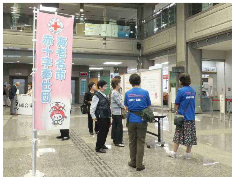
赤十字奉仕団パネル展 海老名市役所1階エントランスホール