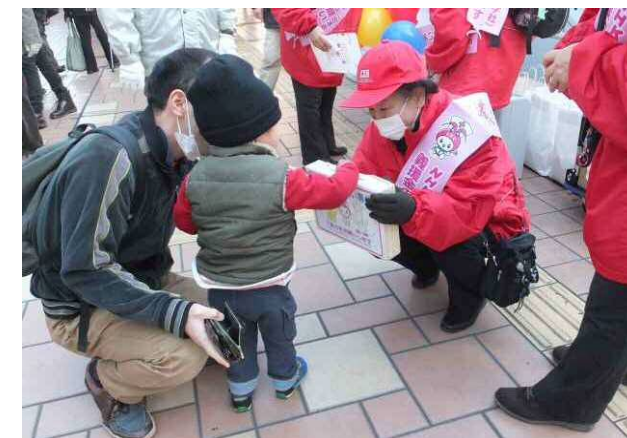
← NHK海外 たすけあい街頭募金