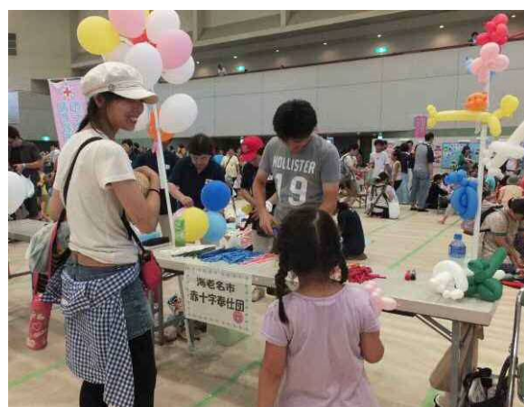
子育てフェスティバル → バルーンアート