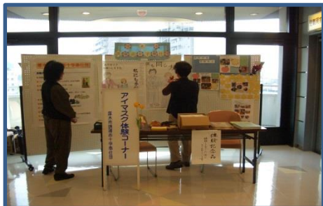
秋に行われるフェスティバルでは 来場者に誘導體験をしていただきます