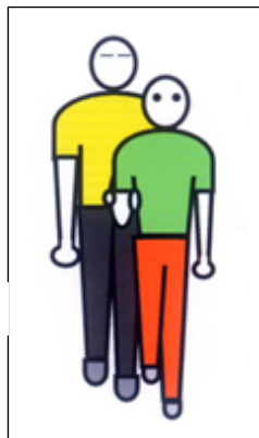
狭い所は縦一列に