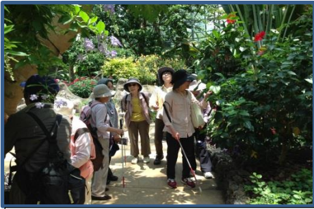
歩こう会 春と秋、視覚障害の方々のウォーキングをサポートします