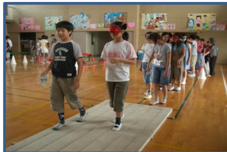
小学校での誘導體験 大人になって視覚障害者を見かけたらサポートお願いね！

ボランティアで社会貢献 ボランティアは楽しいことがいっぱい 一緒に汗を流しましょう