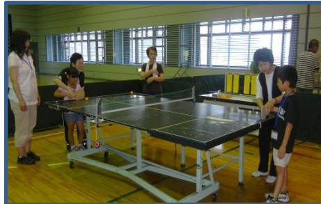
夏休み親子体験教室 親子にサウンドテーブルテニスを体験していただきます