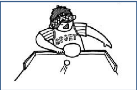
サウンドテーブルテニスは音を頼りにするスポーツ 審判や球拾いなどサポートします