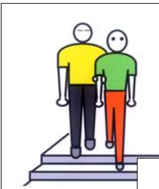
階段は 1段先に降りる