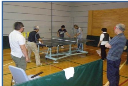
中高生夏休みボランティア体験 実際にボランティアとして視覚障害者をサポート体験