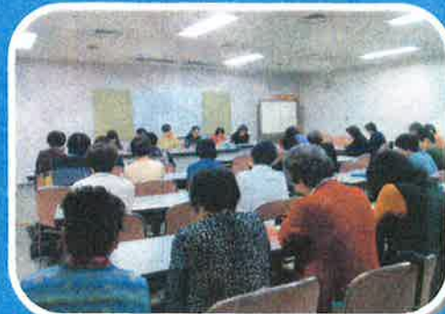
定例会 (毎月第2火曜日)