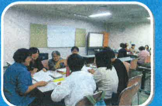
勉強会 (毎月第4火曜日)

*日本赤十字社・厚木市等の行事に参加・協力 *視覚障がい者・点訳・誘導奉仕団の交流・懇親会など