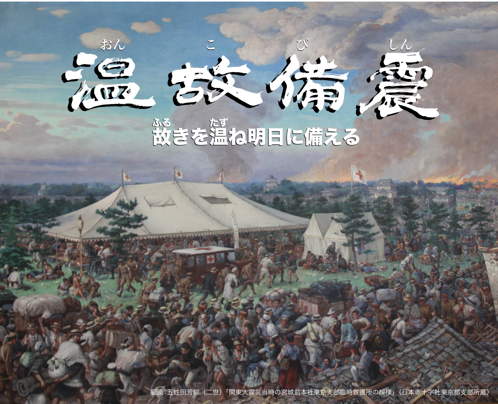
絵画：五姓田芳柳（二世）「関東大震災当時の宮城前本社東京支部臨時救護所の模様」（日本赤十字社東京都支部所蔵）