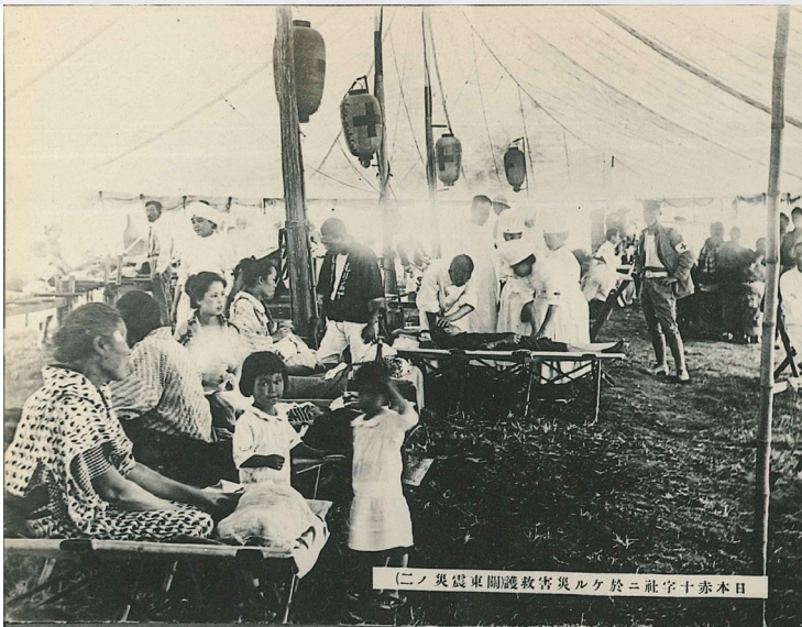
震災当日に設置した皇居前救護所内で傷病者を治療