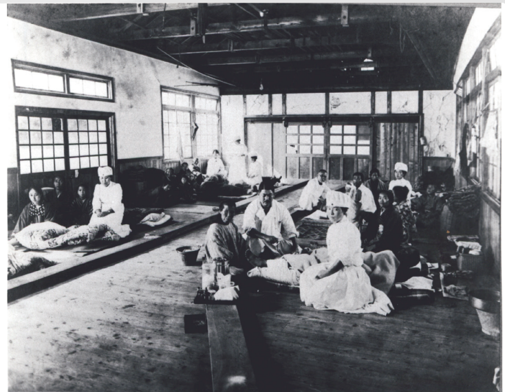
津波被害を受けた千葉県救護所