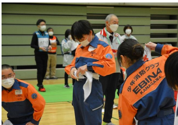
速さと正確さを競う本結びリレー競技