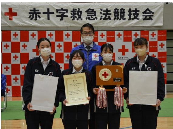
総合優勝チーム「プリキュア」