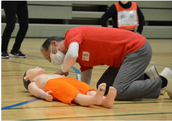
海老名市長も競技に参加されました