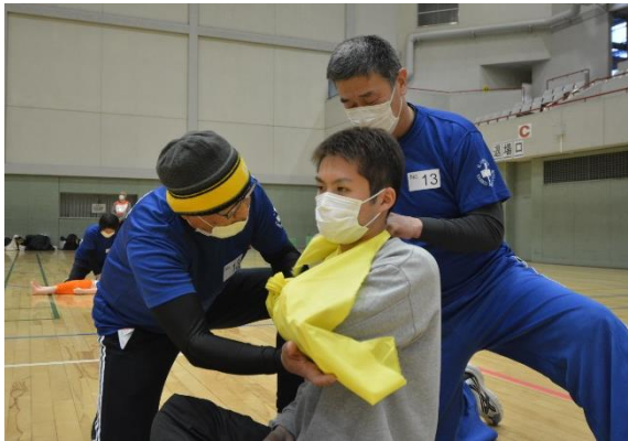
大会のために練習した成果を発揮