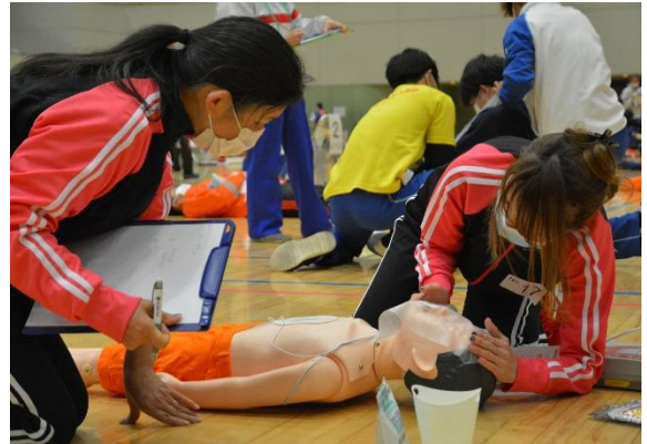
傷病者の状態などを記録し、救急隊へ