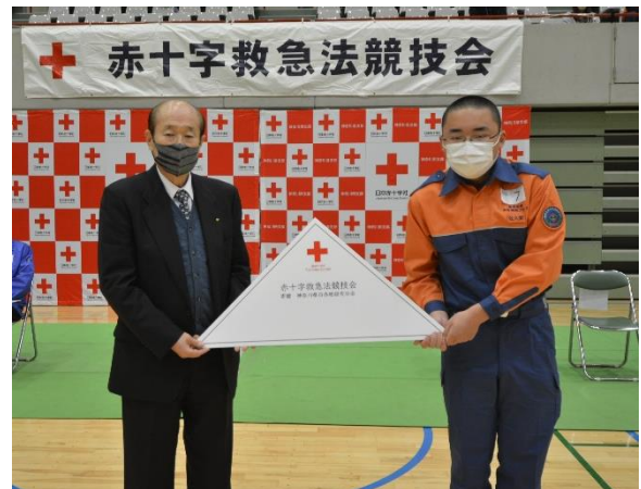
神奈川県日赤紺綬有功会最上会長から 記念品（三角巾）贈呈