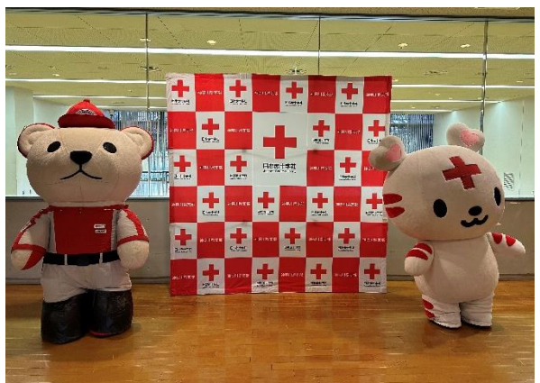
記念撮影コーナー