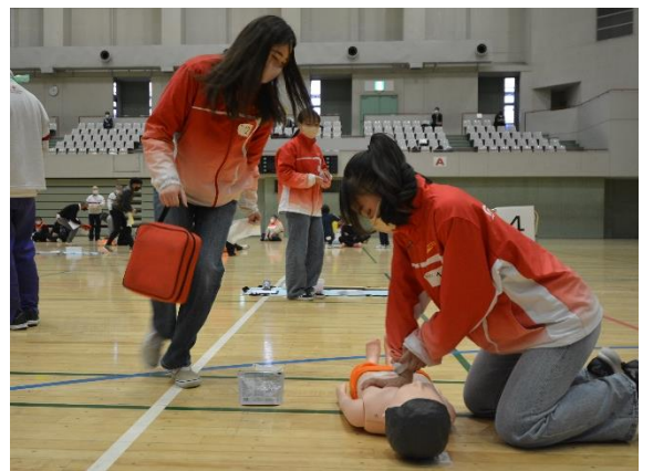
チームワークが問われる総合実技競技