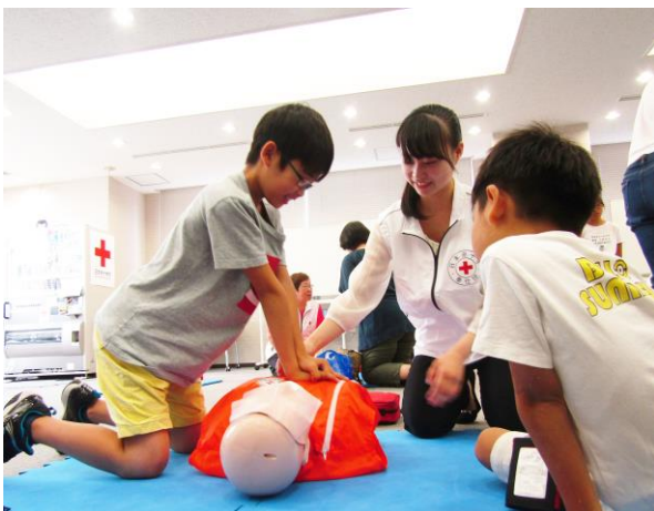
▲訓練用人形を使用した心肺蘇生&AED体験

内容は、救命及び応急手当やアウトドア技術、担架搬送や無線通信など、楽しく体験できるプログラムをご用意しています。