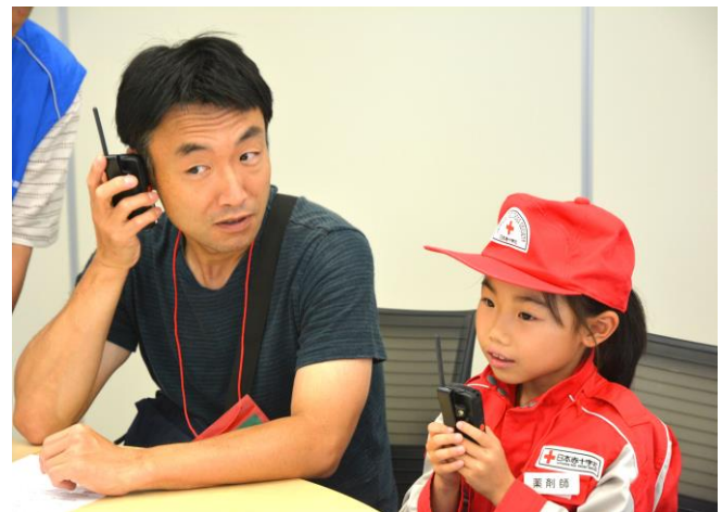
▲無線機を使用した通信体験