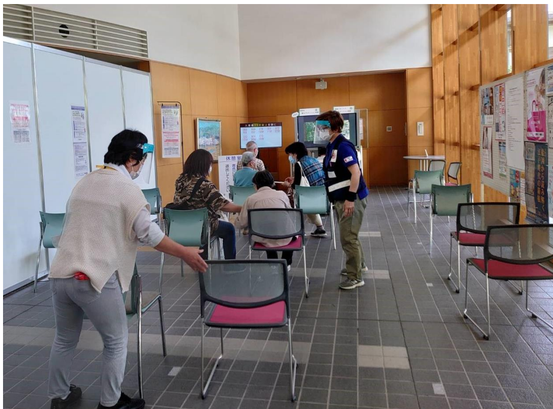
▲ワクチン接種後の経過観察の補助をする様子