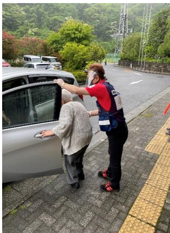
▲安心して会場に来られるよう丁寧にサポート