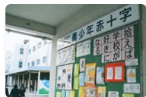
▲青少年赤十字を学校教育の中で採用することについての文部省(当時)の見解