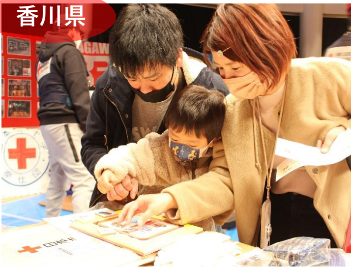
災害シミュレーション“避難所に何をもっていく？”に親子で挑戦！

香川県支部は、「さぬきこどもの国」にて、「防災とボランティアのつどい～親子で学ぼう防災、広げよう減災～」を県内の防災団体と共同で開催しました。阪神・淡路大震災の翌年に始まった同イベントは毎年盛況。今年も500人を超える親子が参加し、ボードゲームや工作、積木、AED体験などを通じて防災意識を高める体験型企画に真剣に取り組みました。