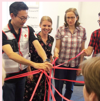
ポーランド:ワークショップでこころのケアのペアワークをする参加者と日本赤十字社員