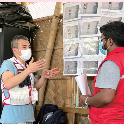
バングラデシュ:生活習慣を変えるためのセッションの説明をする日本赤十字社員