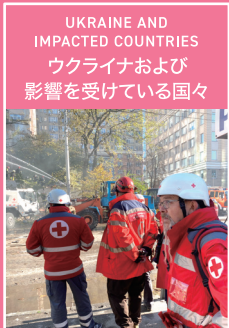
UKRAINE AND IMPACTED COUNTRIES ウクライナおよび影響を受けている国々