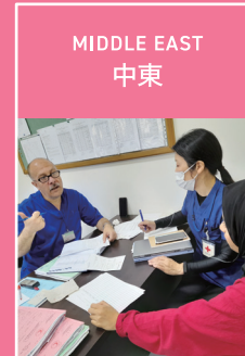
MIDDLE EAST 中東