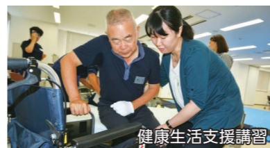
健康生活支援講習