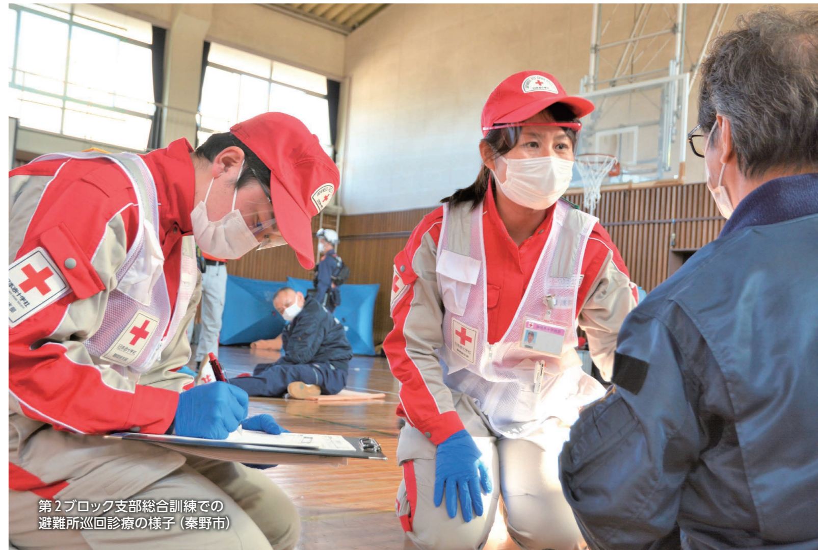
第2ブロック支部総合訓練での避難所巡回診療の様子（秦野市）