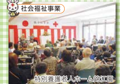
特別養護老人ホーム錦江園