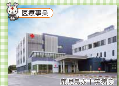
鹿児島赤十字病院

日本赤十字社鹿児島県支部においては、以上の事業のほか、県内の赤十字施設として鹿児島赤十字病院・鹿児島県赤十字血液センター・特別養護老人ホーム錦江園がそれぞれの事業を行っています。