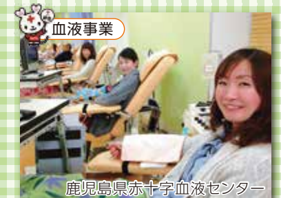
鹿児島県赤十字血液センター