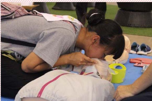
人形を使った人工呼吸の練習中です