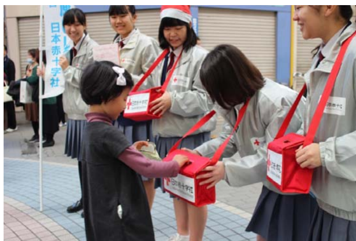
(昨年) 街頭募金の様子