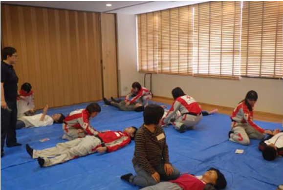
トリアージ実習の様子