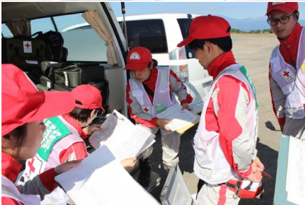
事前ミーティングの様子

日赤鹿児島県支部では、日頃から日赤独自の訓練のほか、県内外の様々な救護関係機関が参加する訓練や各種研修に職員を派遣するなどして、救護に関わる体制の強化に努めています。