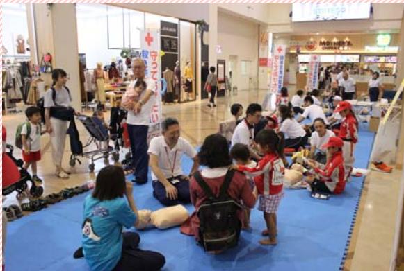
多くの方に足を運んでいただきました♪

また、鹿児島市谷山赤十字奉仕団、青年赤十字奉仕団によるキッズコーナーも併設し、折り紙やバルーンアート等で大変にぎわいました!!