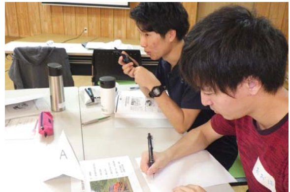
無線を使用した実習