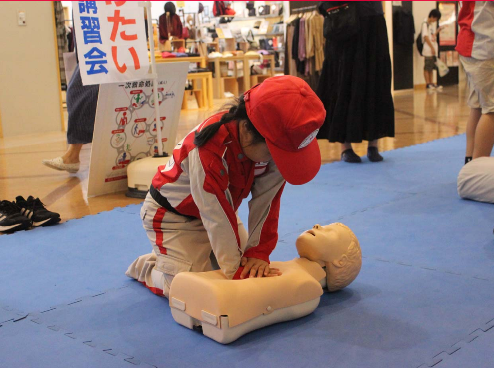
写真：World First Aid Day 2019 (オブシアミスミ)