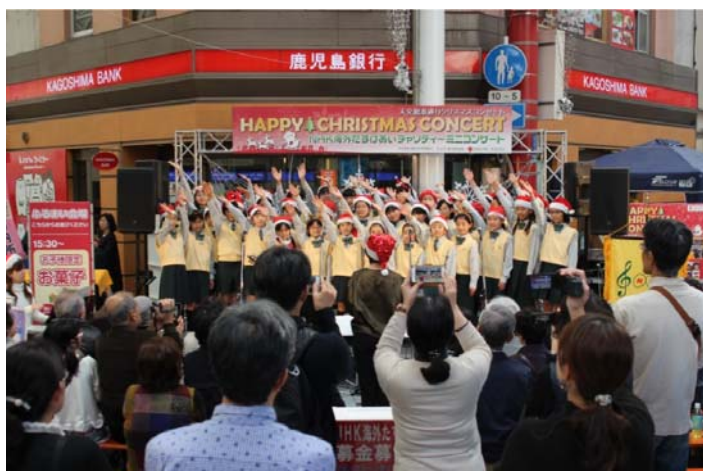
(昨年) 天文館での合唱ミニコンサートの様子

また、下記の日程で街頭募金を実施いたしますので、皆様のご協力のほどよろしくお願いたします。