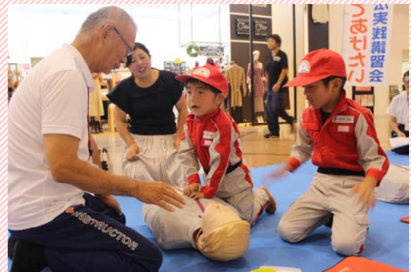
人形を使った胸骨圧迫の練習中です