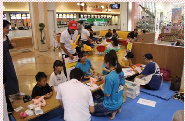
キッズコーナーは子ども達に大人気でした♪