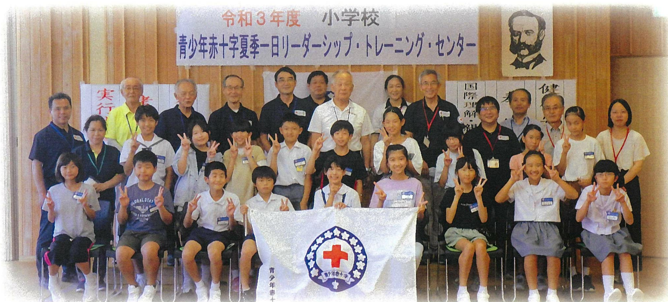
令和3年度 小学校「青少年赤十字夏季一日リーダーシップ・トレーニング・センター」(令和3年8月4日)

今年一年が皆様にとって明るく健やかな年となりますよう心からお祈り申し上げ、年頭のごあいさつといたします。