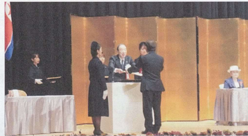
日本赤十字社 清家社長から感謝状の贈呈