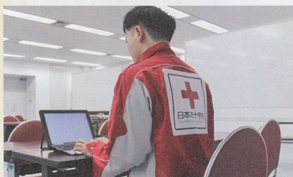
被害状況などの情報収集

発災直後から情報収集を行い、関係機関と連携しながら、要請に応じて救護班の派遣や救援物資の配送を行います。