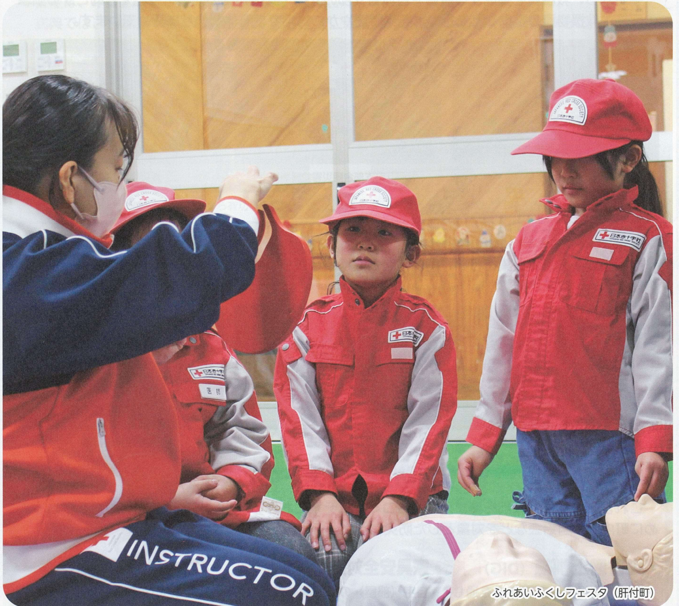
ふれあいふくしフェスタ（肝付町）