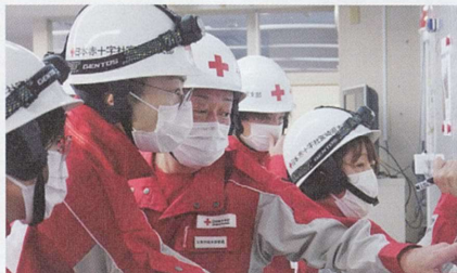
九州八県支部合同災害救護訓練