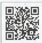
日赤鹿児島県支部HP

URL : https://www.jrc.or.jp/chapter/kagoshima/ Mail : soshiki-rc@kagoshima.jrc.or.jp