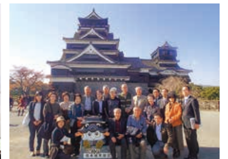
親睦旅行の実施 (平成26年11月熊本地震発生前の熊本城にて)