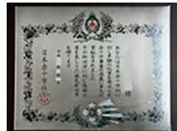
銀色有功章 (個人・法人 橋式)