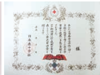
金色有功章 (個人 綬式)