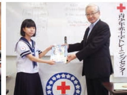
赤十字事業への支援 (青少年赤十字トレーニング・センター参加者に文房具を贈呈)