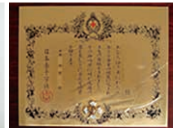
金色有功章 (法人 橋式)

※なお、「日本赤十字社有功章」の伝達式は、毎年、香川県赤十字有功会総会において日本赤十字社香川県支部長（香川県知事）の手渡しにより行なっています。