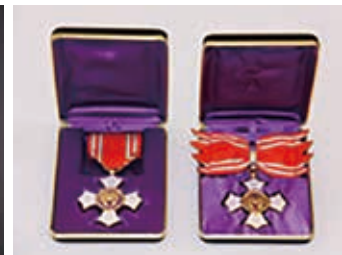
金色有功章 (個人 勲章式)