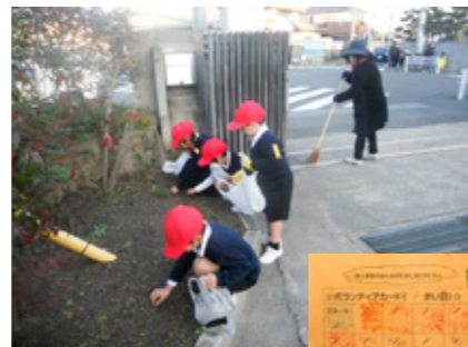
▲ボランティアカード

本校は、近年、都市開発が進み、農地が住宅地となり、児童数が急増しています。急激な人口増により、コミュニティを築きにくい現状です。本校の平成30年度の学校評価アンケート（児童用）の結果から、児童が、「自分から問題に気付き、進んでよりよくするためにボランティア活動に取り組もうとしているか」という項目については、他の質問項目に比べても、低い値を示していました。この現状を少しでも改善するために、以下のような実践を行いました。