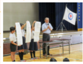
▲まんのう町立四条小学校