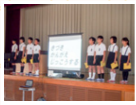
▲多度津町立豊原小学校