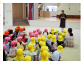
▲直島町立直島幼児学園