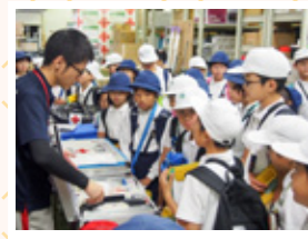
▲校外学習（白赤地下倉庫見学） ▲高松市立中央小学校