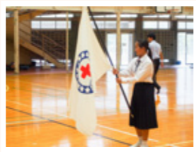
▲直島町立直島中学校