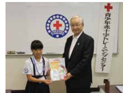
赤十字事業への支援 （青少年赤十字リーダーシップ・トレーニング・センター参加者に記念品を贈呈）