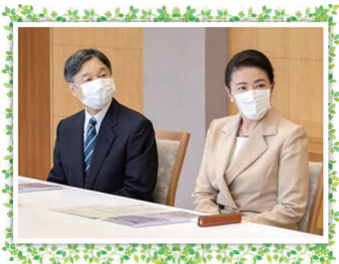
両陛下は多くの資料を手もとに置かれ、具体的な質問を重ねられました

天皇皇后両陛下は、新型コロナウイルス感染症に向きあう医療従事者に対し、励ましのお言葉を述べられました。オンラインによる初のご視察（行幸啓）が実現いたしました。