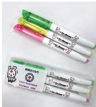
記念品の蛍光ペン