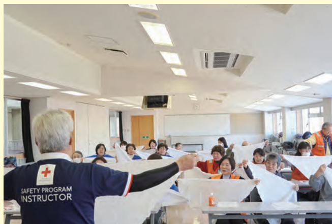
花巻市地区有功会と赤十字奉仕団合同 救急法講習会の様子

また、各地区でも廻りの有功章受章者の方々に、有功会の入会を勧奨していただきますよう「仲間づくり」への推進も併せてお願いいたします。