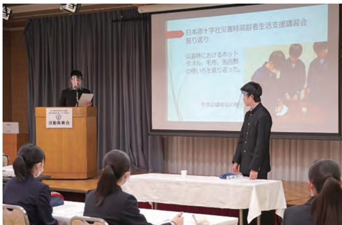
サンセール盛岡で開催されたJRC高校生大会の様子

報告会では、生徒が他校の発表に対し感心する場面も見受けられ、今後の活動のヒントとなったようです。