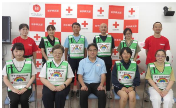
2023.8 絆ボランティアの集いの様子