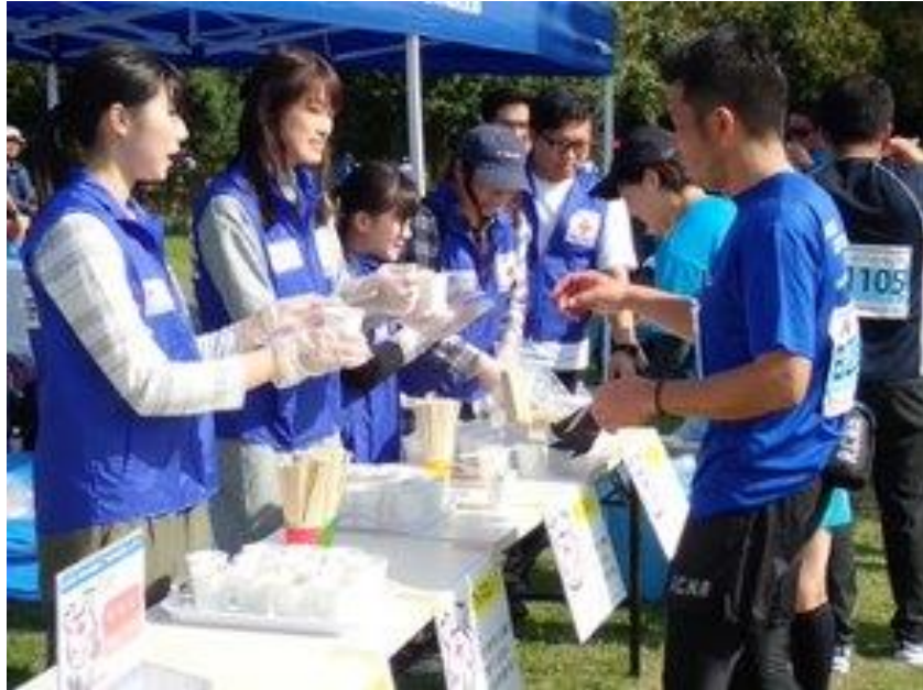
水戸黄門漫遊マラソン