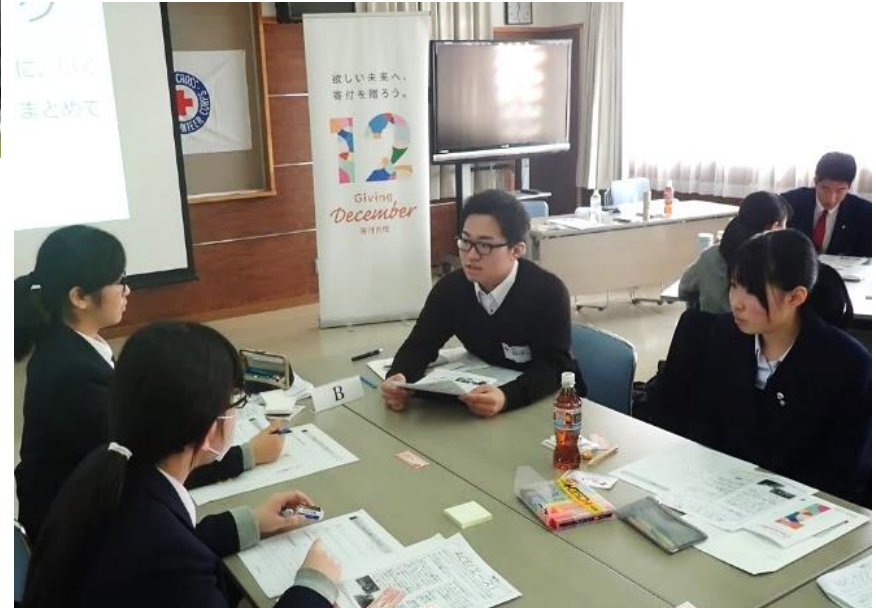
JRCメンバーとの交流会