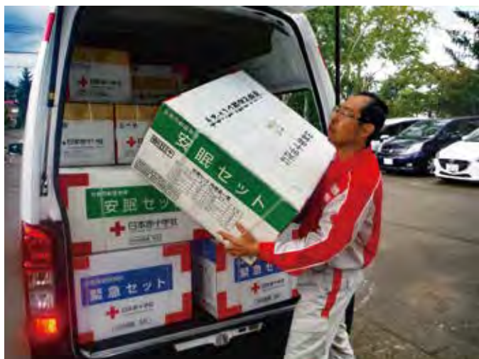
札幌市清田区の避難所へ救援物資を配付