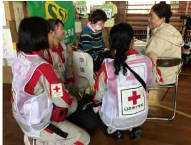
避難所の巡回診療を行うこころのケア班（安平町）

なお、こころのケア活動は、地元医療機関や保健師などでの対応が可能となったことから、10月12日をもって終了しました。