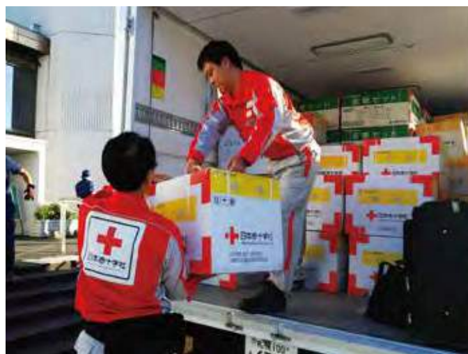
厚真町総合福祉センターへ救援物資を配付