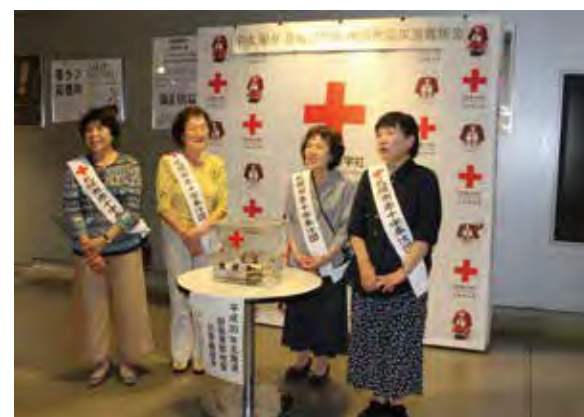
義援金の街頭募集を行う札幌市赤十字奉仕団