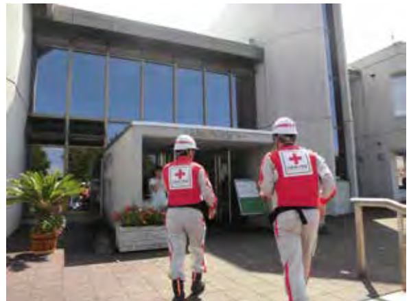
厚真町総合福祉センターへ向かう北海道支部先遣隊