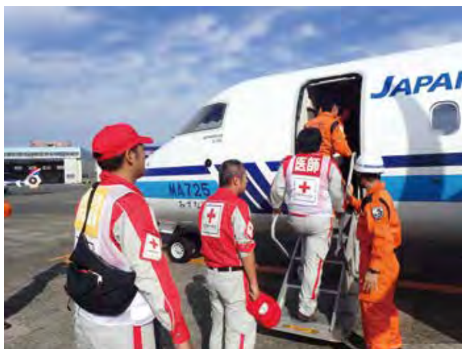
協定を結ぶ海上保安庁の航空機で北海道へ向かう本社先遣隊