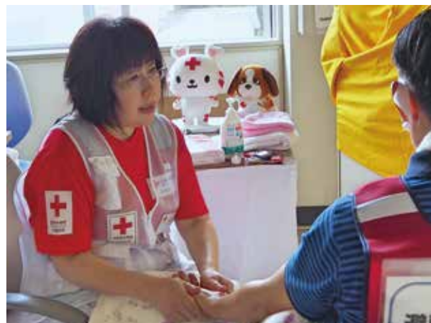
リフレッシュルームでのハンドケア（むかわ町）