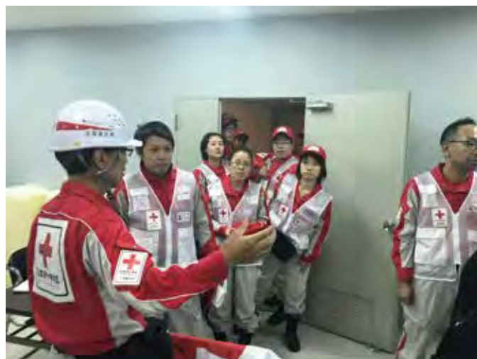
現地災害対策本部へ参集する道内赤十字救護班