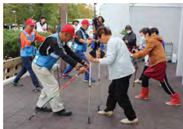
ポールストレッチングによるエコノミークラス症候群予防を行う 北海道ノルディックウォーキング赤十字奉仕団(厚真町)