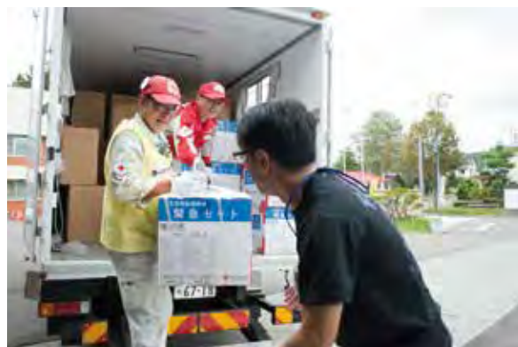
救援物資配付支援を行う防災ボランティア(安平町)