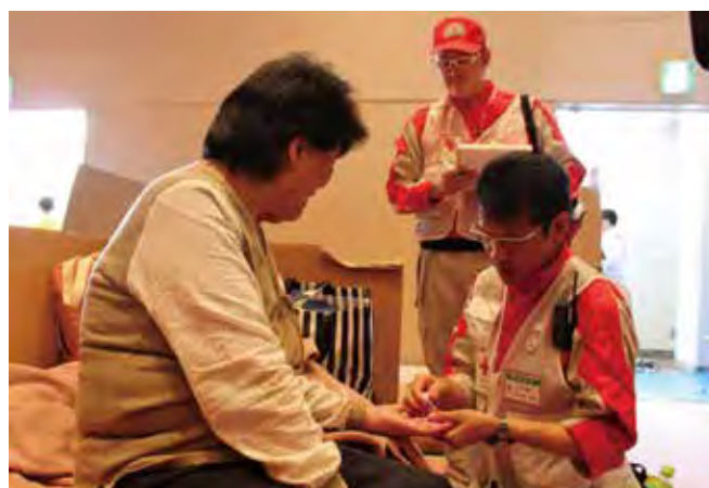
避難所の巡回診療を行う救護班(安平町)