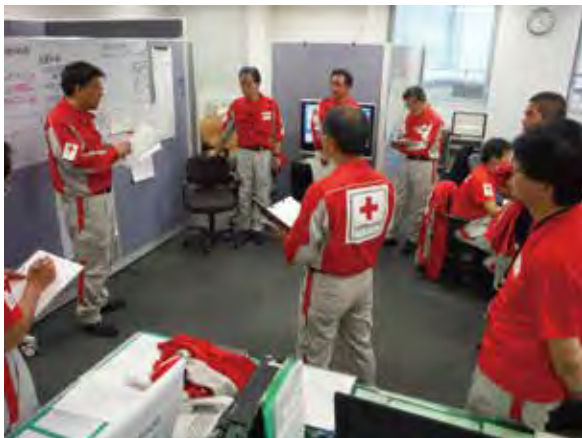
北海道支部災害救護実施対策本部の様子

あわせて、情報収集・ニーズ調査の結果をもとに、毛布・安眠セット・緊急セットの救援物資を札幌市清田区・厚真町・安平町・むかわ町の各避難所へ緊急輸送しました。