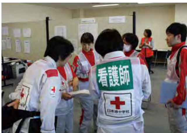
避難所巡回前にこころのケア調整班と打合せを行うこころのケア班