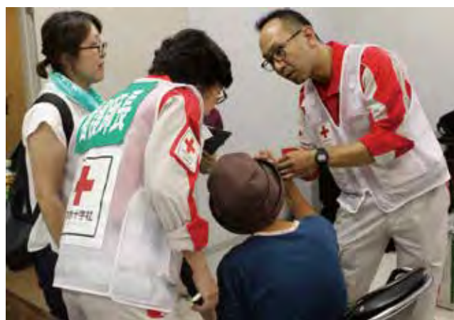
救護所に診察を受けにきた被災者

医療ニーズの減少並びに地元医療機関の診療が再開したことに伴い9月20日をもって救護班による医療救護活動を終了、発災より43班の救護班と13班の日赤災害医療コーディネーターが活動しました。