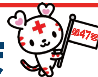
日本赤十字社 マスコットキャラクター ハートワゴン