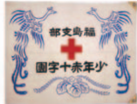
当時の福島支部 少年赤十字団 団旗

青少年赤十字 (Junior Red Cross、以下JRC) のはじまりは、第一次世界大戦時にカナダ・アメリカなどの子どもたちが赤十字に依頼して、