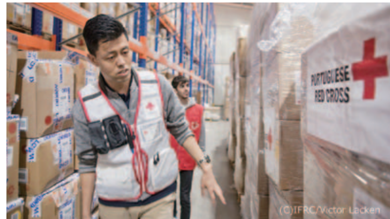
ウクライナ西側のモルドバ共和国で救援物資倉庫の管理責任者に任命された大阪赤十字病院職員