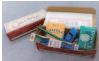
クレヨン・石けん・歯ブラシ・おもちゃが入ったアメリカからのギフトボックス

戦争の被害にあった子どもへの慰問品集めや包帯づくりなどの奉仕活動を行ったことがきっかけでした。当支部にも、第二次世界大戦の終戦後にアメリカの子どもたちから送られた「ギフトボックス」が現存しています。文房具や衛生用品などがメッセージとともに詰められており、当時に思いを馳せることができます。JRCはそんな「優しさ」や「思いやり」から生まれ、現在に至るまで脈々と受け継がれてきました。