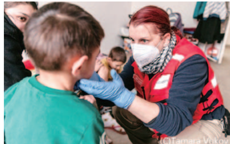
ウクライナからの避難者に保健医療支援を実施するハンガリー赤十字社ボランティア