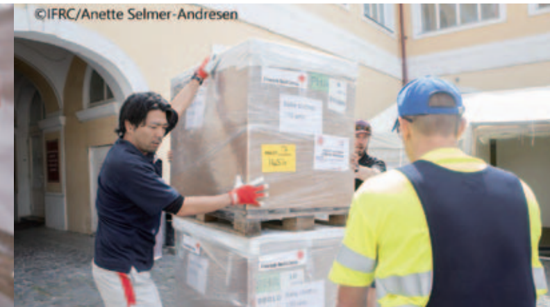
ウクライナ西部で避難民に対応する仮設診療所をフィンランド赤十字社と設置する大阪赤十字病院薬剤師