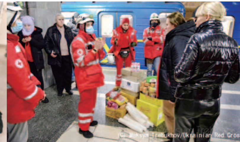
キーウの地下鉄駅に避難している人々に食料や必要な物資を配付するウクライナ赤十字社