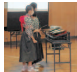
二本松第一中学校の公開授業では ちょうちんまつりの紹介で太鼓を披露

消毒の徹底や換気などの他、オンラインで別の教室でも授業が参観できるよう、密にならない対策も講じました。