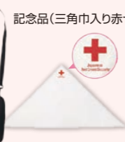
記念品(三角巾入り赤十字ポーチ)