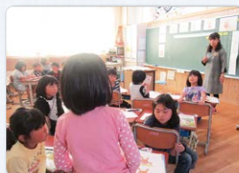
1年生 健康・安全 元気に生きていることの素晴らしさに気づこう。