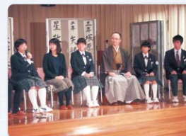
異世代文化交流 新たな気づきがありました。