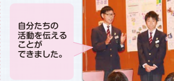
自分たちの活動を伝えることができました。