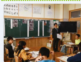
6年生 奉仕 社会のために尽くす。マザー・テレサの生き方から。