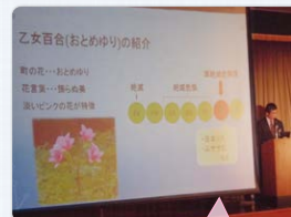
おとめゆり祭りのポスターを作成しました。