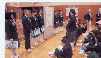
活発な質疑がありました。