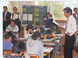
6年生 国際理解・親善