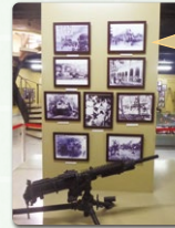
サマセット山戦争資料館