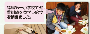
福島第一小学校で避難訓練を見学し給食を頂きました。