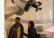
福島東稜高校の天体望遠鏡に