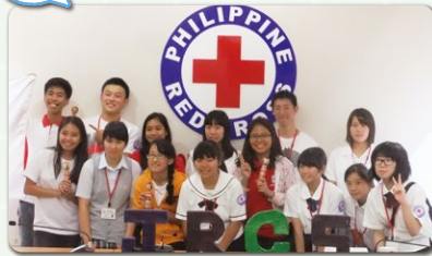
ユースメンバーにこけしをプレゼントしました。