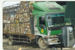
バヤタス地区にゴミを運ぶトラック