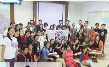
バタアン支部に近隣の高校生が集まりました。