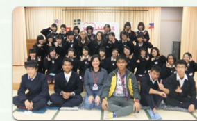
あさが開成高校のみなさんと。