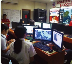
フィリピン全土の気象情報が集まるオペレーションセンター