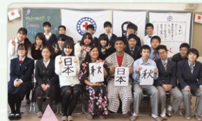
東北JRCとの交流会 着付けや書道を楽しみまし

International Meeting “Tokyo 2016”に参加するため、フィリピンから2人のユースメンバーが福島にやってきました。震災以降6年ぶりです。(10月29日⑤～11月3日⑥)