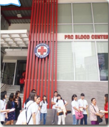
フィリピン赤十字本社