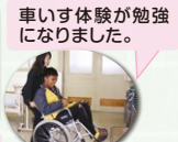
車いす体験が勉強になりました。