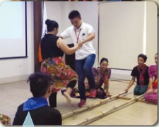
民族舞踊、バンブーダンスに挑戦