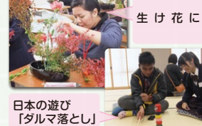
日本の遊び「ダルマ落とし」