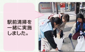
駅前清掃を一緒に実施しました。