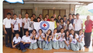
ラスピニャス支部のみなさんと