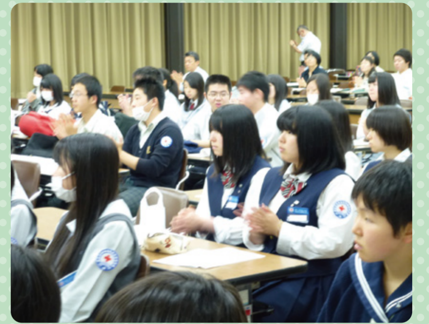
県内各地から集まりました。