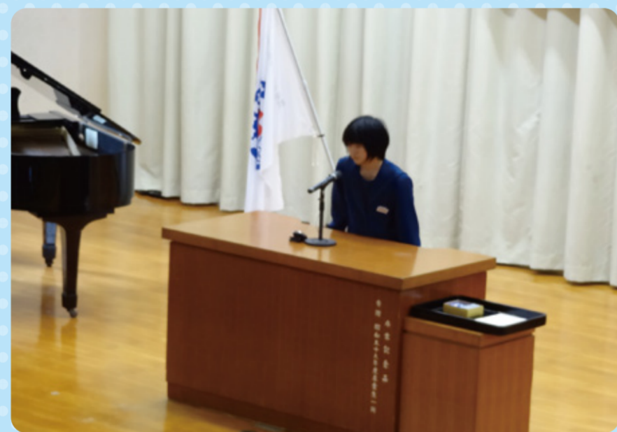
誓いの言葉を全校生で唱和しました。