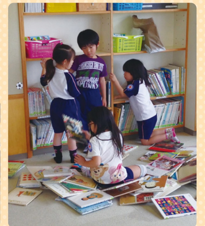
ワッペンをつけての図書の整理です。