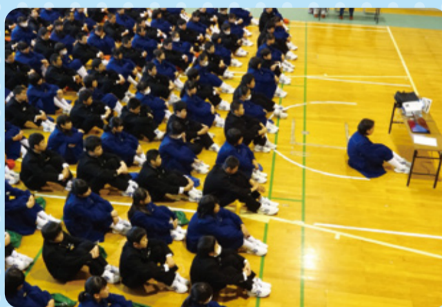
全校生で青少年赤十字を学びました。