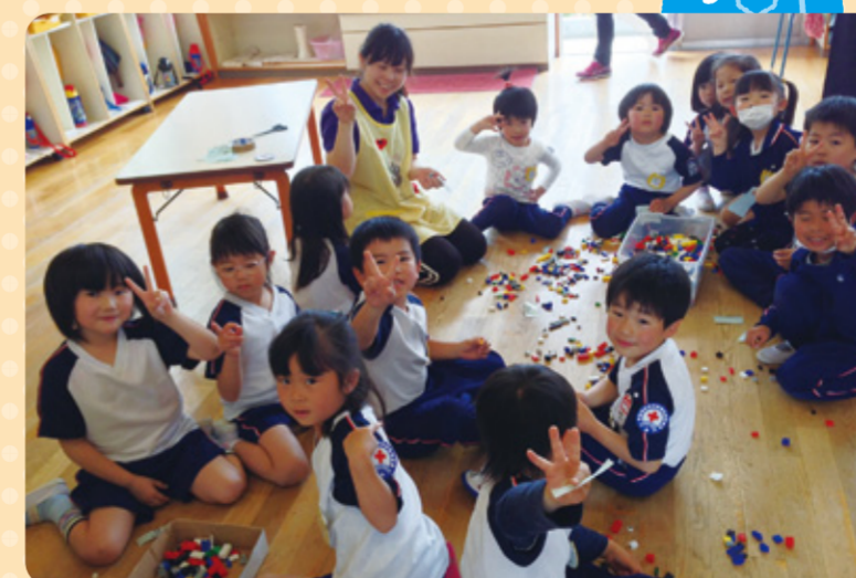
ワッペンをつけるとやる気が出ます。