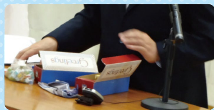
日本の子どもたちに第2次世界大戦後に届いた グリーティングボックスです。