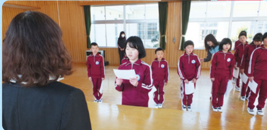
代表が宣言しました