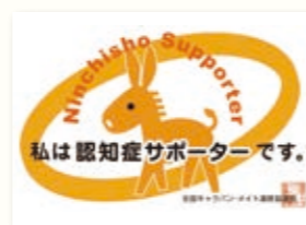
認知症サポーターカード