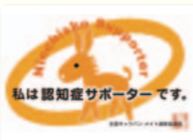
認知症サポーターカード