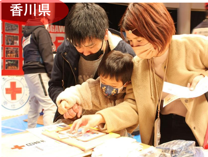
災害シミュレーション“避難所に何をもっていく？”に親子で挑戦！

香川県支部は、「さぬきこどもの国」にて、「防災とボランティアのつどい～親子で学ぼう防災、広げよう減災～」を県内の防災団体と共同で開催しました。阪神・淡路大震災の翌年に始まった同イベントは毎年盛況。今年も500人を超える親子が参加し、ボードゲームや工作、積木、AED体験などを通じて防災意識を高める体験型企画に真剣に取り組みました。