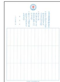
【メンバー署名票】 上段：青少年赤十字 下段：こども赤十字