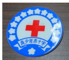
ワッペン 直径：70mm ビニール製 裏面安全ピン付き