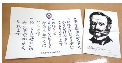
【アンリー・デュナン像】 上段：青少年赤十字 「ちかい」 下段：こども赤十字 「こども赤十字のやくそく」