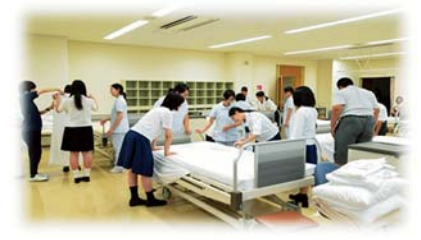
介護体験学習(ベッドメイキング)の様子