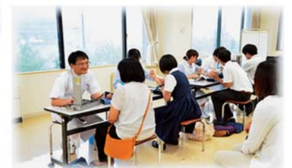
看護体験学習(血圧測定)の様子

※開催時間については、変更になる場合があります。詳しくはHPでお知らせいたします。