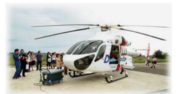
ドクターヘリ見学会の様子