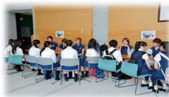
先輩と語ろうコーナーの様子