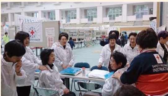
町民祭でリラクゼーションを実施 事前確認をする奉仕団員

赤十字奉仕団とは、赤十字の使命とする人道的な諸活動を実践しようとする人々が集まって結成されたボランティア組織で、赤十字事業推進のためのお手伝いをしています!