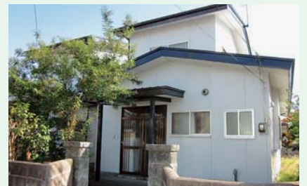
乳児院の近くの1軒家を借用し「家庭体験事業」を実施します！なんと間取りは4DK！