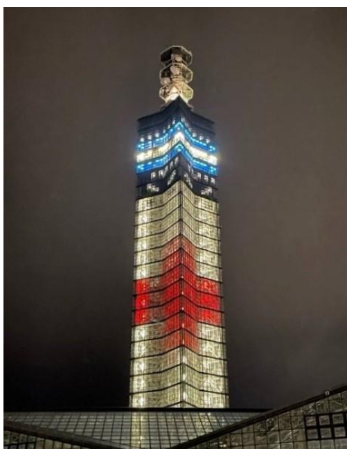
秋田市のポートタワー「セリオン」をライトアップ (赤十字レッドライトアップ)