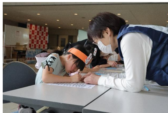
点訳奉仕団による点訳体験

赤十字有功章受章者の有志により組織されている「秋田県赤十字有功会」の事務局として、会の円滑な運営と活動の推進に努める。