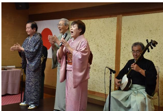
芸能奉仕団の民謡披露