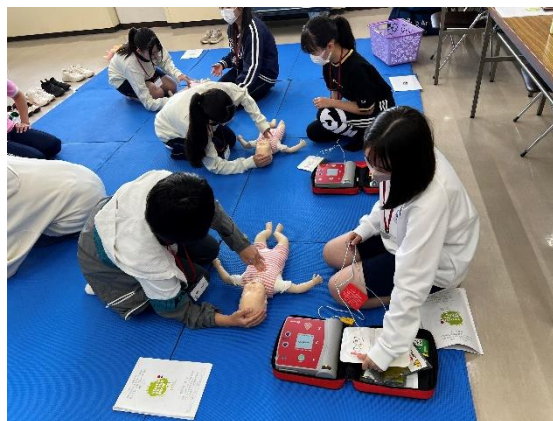
幼児安全法 短期講習