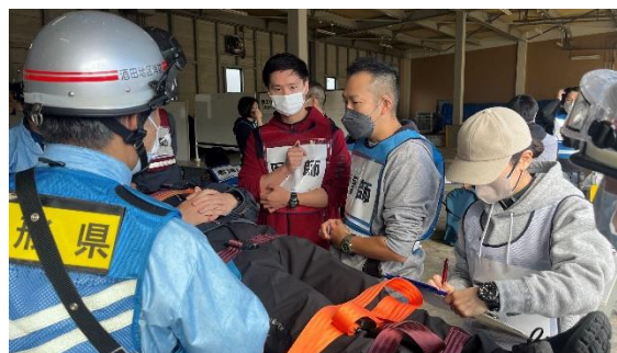
多数傷病者受入訓練