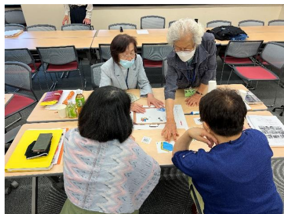
賛助奉仕団 研修会