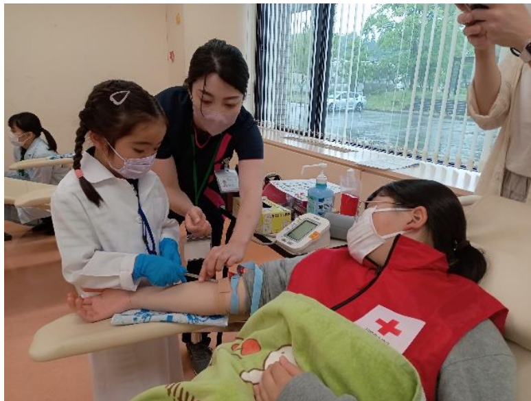
赤十字キッズタウンでの採血体験

献血 Web 会員サービス（ラブラッド）の会員及び献血登録者に対して献血協力依頼や情報提供を積極的に行い、複数回献血者の推進に努める。