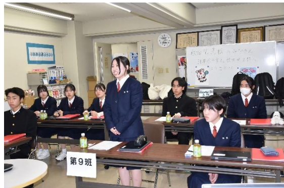
秋田南高等学校「国際探求」におけるフィールドワーク