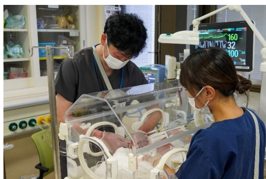
総合周産期母子医療センター(NICU)