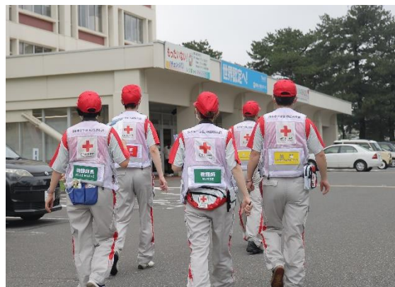
被災地でコーディネートチームが活動 (令和6年7月25日からの大雨災害)