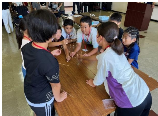
リーダーシップ・トレーニング・センター（小学生）