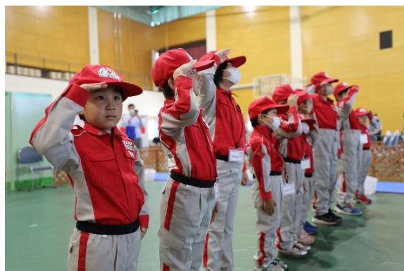
子ども対象のお仕事体験イベントを開催 (赤十字キッズタウン)