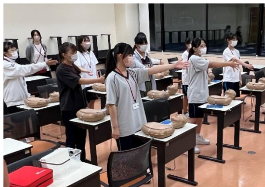
リーダーシップ・トレーニング・センター（中高生）