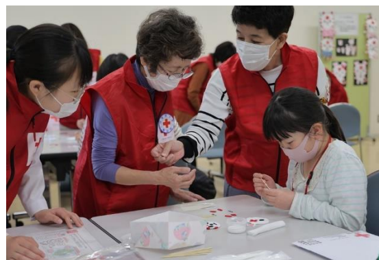
秋田市赤十字奉仕団による ハートラちゃんワッペン作り体験