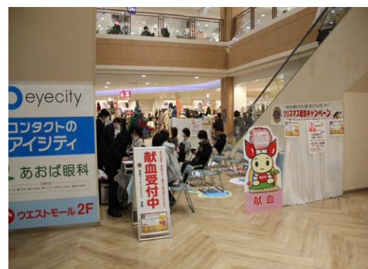
「ライオンズクラブクリスマス献血キャンペーン2024」