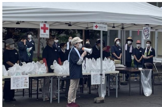
地域での活動を通して 赤十字思想を普及する奉仕団