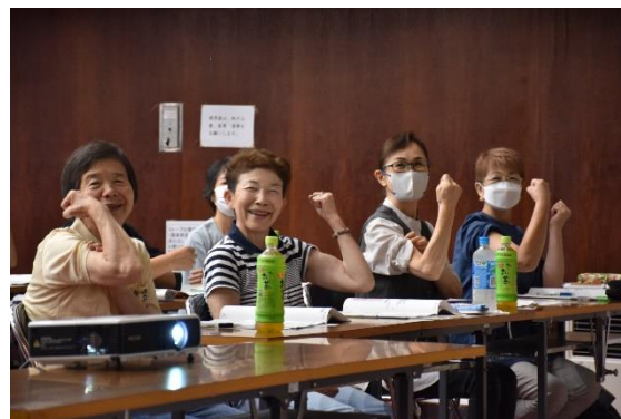
フレイル予防サポーター養成講座(井川町)