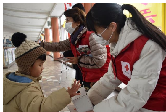
地域奉仕団・JRC メンバーが共同で街頭募金活動