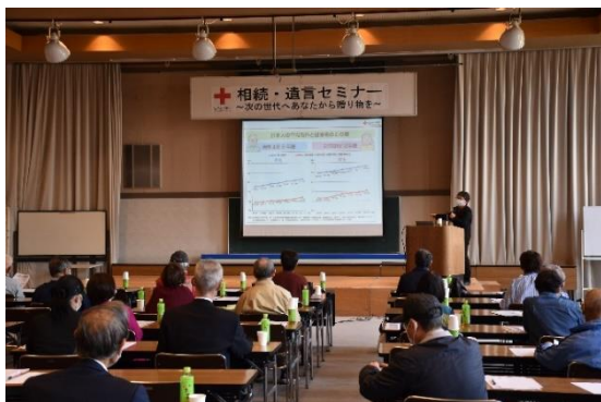
関係機関と連携し、開催している 相続・遺言セミナー