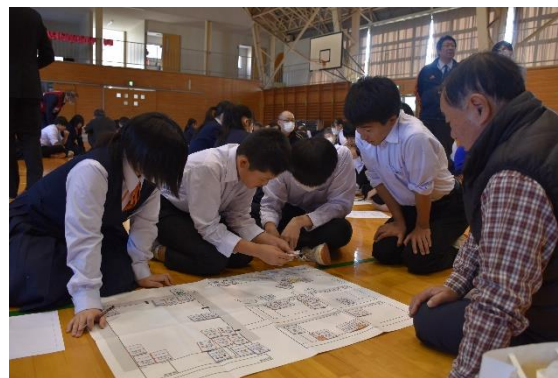
防災セミナーの様子