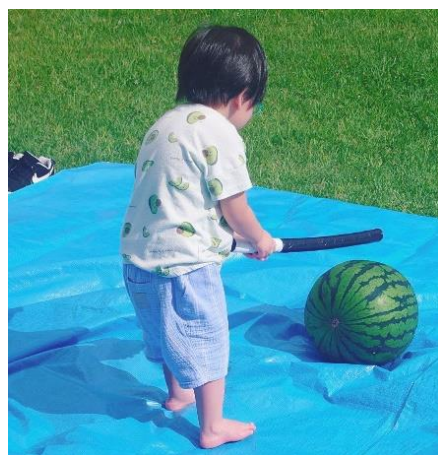
季節行事(すいか割り)