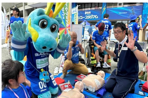
ブラウブリッツ秋田のマスコット 「ブラウゴン」と救急法講習会でコラボ