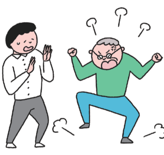
暴力・暴言・サポート拒否

普段の何気ない行動が意識するとできなくなります。財布を出してお金を払ったり、箸やスプーンの使い方がわからなくなることも