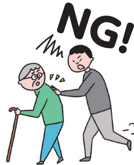
困っているように見えても、背後から唐突な声掛けは恐怖心をおおるのでNG

こちらが困惑や焦りを感じていると、相手にそれが伝わりかえって動揺させることに。落ち着いて笑顔で対応しましょう。もし相手が怒りだすなど反発した時は、止めようとする余裕と余裕を持って対応することも。その場合は離れて見守ります