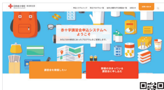
開催が決定している講習会への受講申し込みも可能 https://niigata-jrc-seminar.jp/

日赤新潟県支部は、赤十字救急法や防災プログラムなどの各種講習にWEBで申し込める新システムを開発しました。初めての方でも講習内容を理解しやすいように画像や動画を多用し、選択項目も細分化。防災プログラムでは、数ある講習の中から災害の種類(地震・風水害など)を選択し、さらに救急法との組み合わせも可能など、利用しやすさを重視しています。