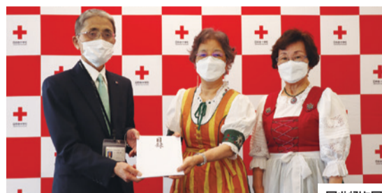
「ウクライナ人道危機救援金」受付中 募金期間:~2022年9月30日(金)まで

ウクライナ国内および周辺国での赤十字の救援活動、人道支援に多くの関心をいただいています。各県の日赤支部では、赤十字ボランティア、企業や市民団体から「ウクライナ人道危機救援金」にご支援が寄せられ、岐阜県支部では岐阜ミセスフォークダンスクラブの皆さまから救援金を託されました。この紛争に苦しむ人々を救いたい、という思いが全国に広がっています。