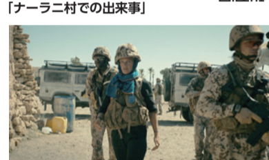
ドイツ制作ドラマ。武装グループのわなにかかり生き残ったのは、開発援助に関わるカーリナと若い兵士・ルカ。2人はそれぞれの目的に向かって戦うことに

表参道など複数の会場のほか、オンラインでも無料配信されます(一部有料)。 「戦争と生きるカプログラム」配信・上映期間:6月4日(土)~30日(木)を予定。作品紹介・視聴方法など、詳しくは2次元バーコードから。