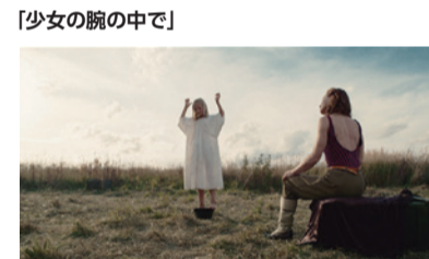
ナチスに村を焼かれた少女がサーカス団と行動をともにする。一行はのちにナチスと遭遇し、少女のジャグリングが運命を握ることに。ロシア制作ドラマ