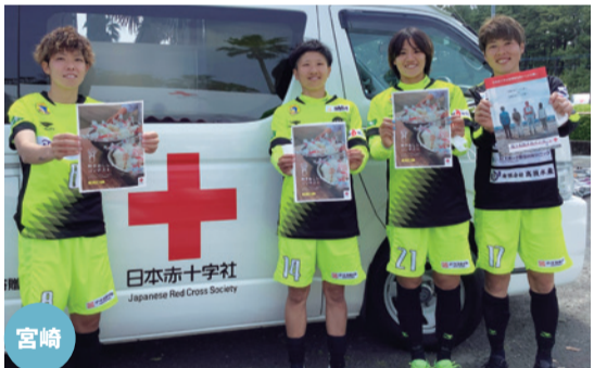
選手らは炊き出しも体験(撮影用にマスクを外しています)