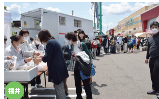
ハイゼックス非常食の炊き出しにも長蛇の列が

女子サッカークラブ「ヴィアマテラス宮崎」とコラボレーションした宮崎県支部。ホーム開幕戦に合わせて試合会場で運動月間イベントを開催し、選手たちと共に赤十字の活動をPRしました。日頃から献血にも協力してくれる選手たちの熱心な呼び掛けは、入場者400人の関心を集めました。