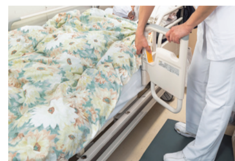
成田赤十字病院では、認知症の方のベッド脇に開閉できる手すりや足元に緩衝マットを設置して安全を強化している

認知症の方が病院に運ばれてくる最も多い原因が、転倒による骨折です。高齢による足腰の筋力の低下に加えて、認知症の方は空間を把握する機能が低下していたり、視野が狭くなっていたりすることもあるため、周囲に注意を払うのが苦手になります。