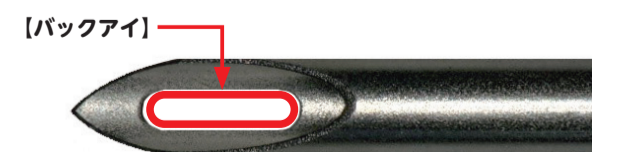
バックアイができる前は、血管壁に針の背面が張り付いて採血が止まってしまうことが多く、その度に看護師が針の向きを変えていた