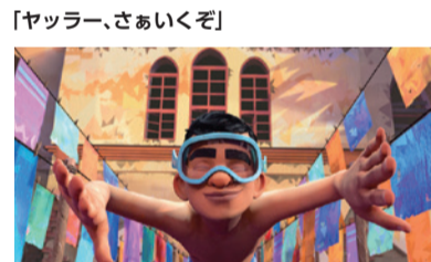
1982年のベルリートを舞台にしたフランス制作アニメ。内戦で破壊された故郷を離れる決意をした主人公のニコラスの前に無謀な若者ナジが現れる