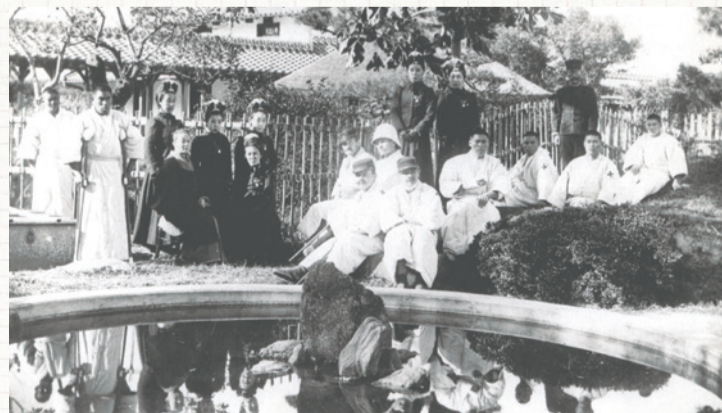
北清事変(1900年・明治33年)の負傷兵を慰問する篤志看護婦人会