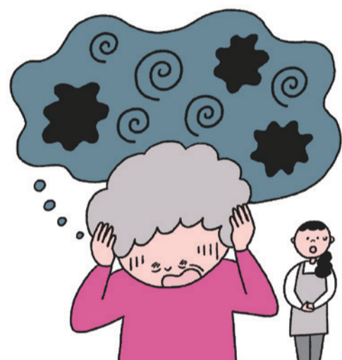
せん妄(錯乱・幻覚)

考えの通りにならないことへの不満や、介護者からの命令や制止への対抗から暴言をはいたり介護やサポートを拒否することがあります