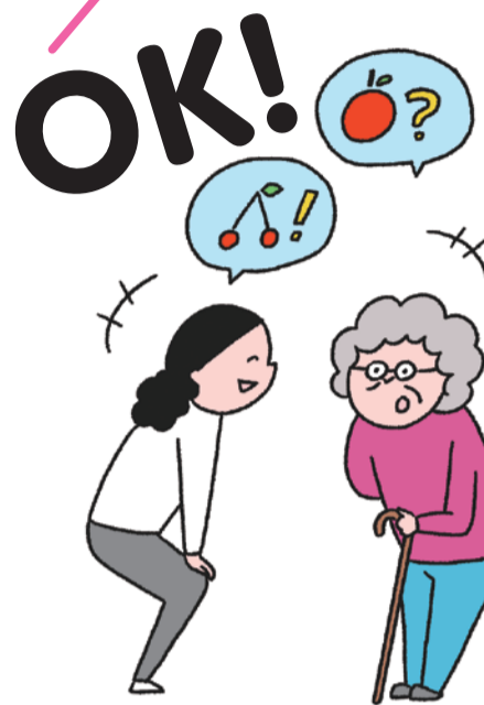
認知症の人は強い不安を感じています。目線を合わせ優しい対応が大切です