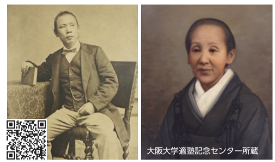
常民(左)と八重の肖像。適塾は大阪大学の精神的源流と言われる

日赤の創設者・佐野常民は緒方洪庵の「適塾」で医学を学び、「医は仁術」の精神を教えられました。洪庵の妻として塾生たちを支えた緒方八重と常民は共に文政5年(1822年)生まれ。適塾記念センターでは、生誕200年記念シリーズとして「緒方八重と佐野常民」(6月12日まで)の特別展示を開催。幕末の時代を見つめる八重の書状や常民の漢詩など貴重な史料が公開されます。