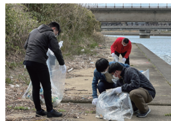
河川の清掃作業を通じて、地域に密着して謙虚に感謝する精神と「世の中に役立っている自分が見える」人材を育成する

八幡グループは、昭和41年に持ち帰り用の寿司を販売する「八幡寿司」として創業し、現在は持ち帰り寿司・弁当販売のほかに大型居酒屋や寿司店を経営するなど石川県全域で事業を展開しています。「笑顔の食ランド・夢ランド」というメッセージと共に、笑顔を生み出すメニュー開発や店づくりに注力。人材育成にも力を入れ、新入社員研修の一環として河川の清掃を行うなど、その地域になくはならない企業を目指しています。 同社の社訓の1つが「我々は、日々の仕事を通じてより多くの人々を幸福に いかにか寄与するかを考え、「心の豊かさ」を創造せよ!」です。この実践と赤十字の活動には相通じるものがあると考え、日頃から赤十字活動の推進に協力。昨年度は日赤石川県支部が計画した「愛と平和のワンコイン募金」に賛同し、店頭で募金箱を設置して活動を支援しました。