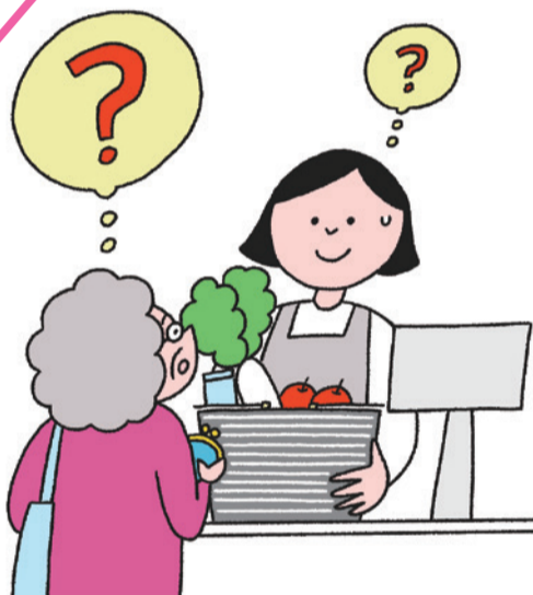
失行・失認・失語

普段の何気ない行動が意識するとできなくなります。財布を出してお金を払ったり、箸やスプーンの使い方がわからなくなることも