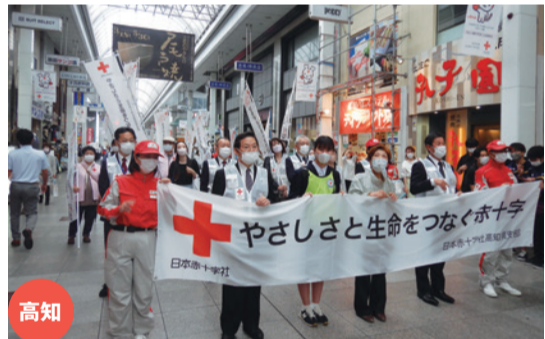
観客からは「街が明るくなっているね」と好評