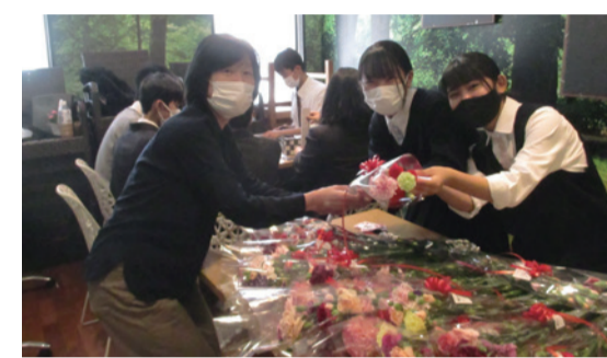
「母の日献血」は全国各地の献血ルームで華やかに実施された

コロナ禍による献血者減が解消されず、広島県では4月だけでも計画の800人を下回る、ぎりぎりの状況です。そんな中、5月の母の日に献血した方にカーネーションをプレゼントする「母の日献血」が広島県内2カ所の献血ルームで実施されました。花き園芸農業協同組合カーネーション部会から提供された花は600本。ボランティアの学生らから手渡された花を献血協力者は笑顔で受け取りました。