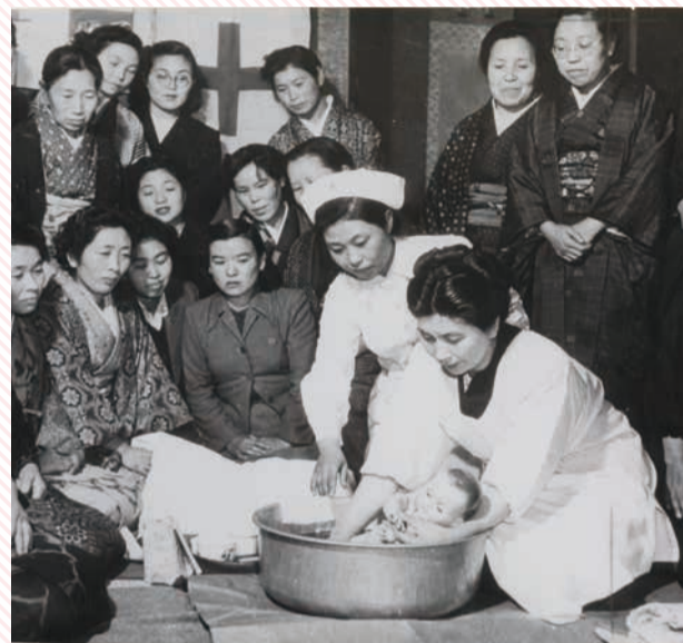
赤ちゃんの入浴法をまなぶ 赤十字家庭看護法の講習風景(1950年代)

1951(昭和26)年、講習は二部制になります。「第一部」は、家庭での看護と感染症予防などを学ぶ内容。「第二部」は、妊娠・分娩、乳幼児のケアを学ぶものです。そこには、乳児死亡率がきわめて高かった当時、赤ちゃんの命を守るために、家庭でできることを広めたいという思いがありました。1972(昭和47)年、来るべき高齢化社会に向けて、老人看護の「第三部」が新設されます。超高齢社会*となった現在、「家庭看護講習」は、家庭から「地域での支え合い」のための「健康生活支援講習」へと発展。誰もが健やかに生きられる社会を目指して、全国各地で実施されています。