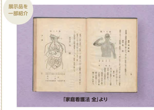
展示品を一部紹介