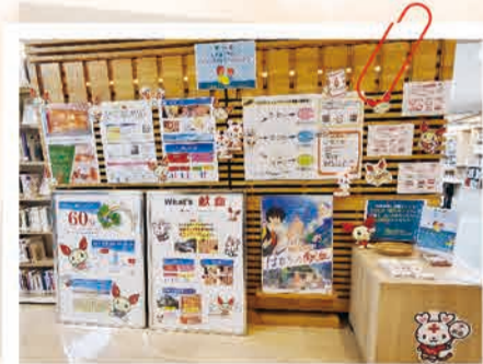
図書館の一角に設けられた展示スペース。スタッフが資料やパネルを運び込み、準備を進めます

この高校生の協力、始まりは「何か手伝えませんか」と、生徒自ら献血ルームへ相談に来たのがきっかけ。彼女たちが青少年赤十字のメンバーであることは後から判明しました。 今年3月、卒業式の後に参加生徒たちが「自分もなにか社会の役に立てたことが、うれしかった」と話していたそうです。 図書館イベントも3年の節目を越え、新しい代に、引き継がれます。