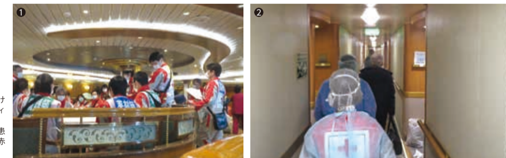
①クルーズ船内の吹き抜けのある中央ロビーでミーティングを行う日赤救護班 ②DMATとして症状のある患者のいる客室へ向かう日赤救護班の後ろ姿