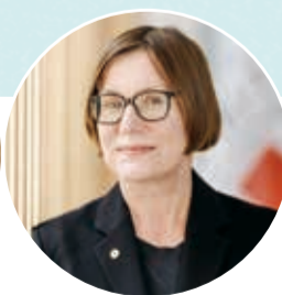
赤十字国際委員会 ミリアナ・スポリアリッチ総裁