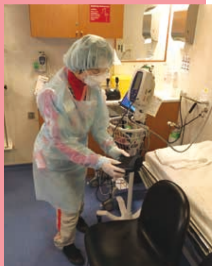
クルーズ船内の診療所での園分師長