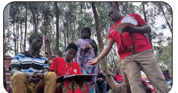
共同貯金の帳簿をつける村人たち

日赤の「モデルビレッジ」事業は新たな村を対象にして継続し、赤十字ボランティアの活動も続いていきますが、新しい場所でも、村人自らが行動を起こしてその変化を実感し、これから人道の輪が広がっていくことを願っています。