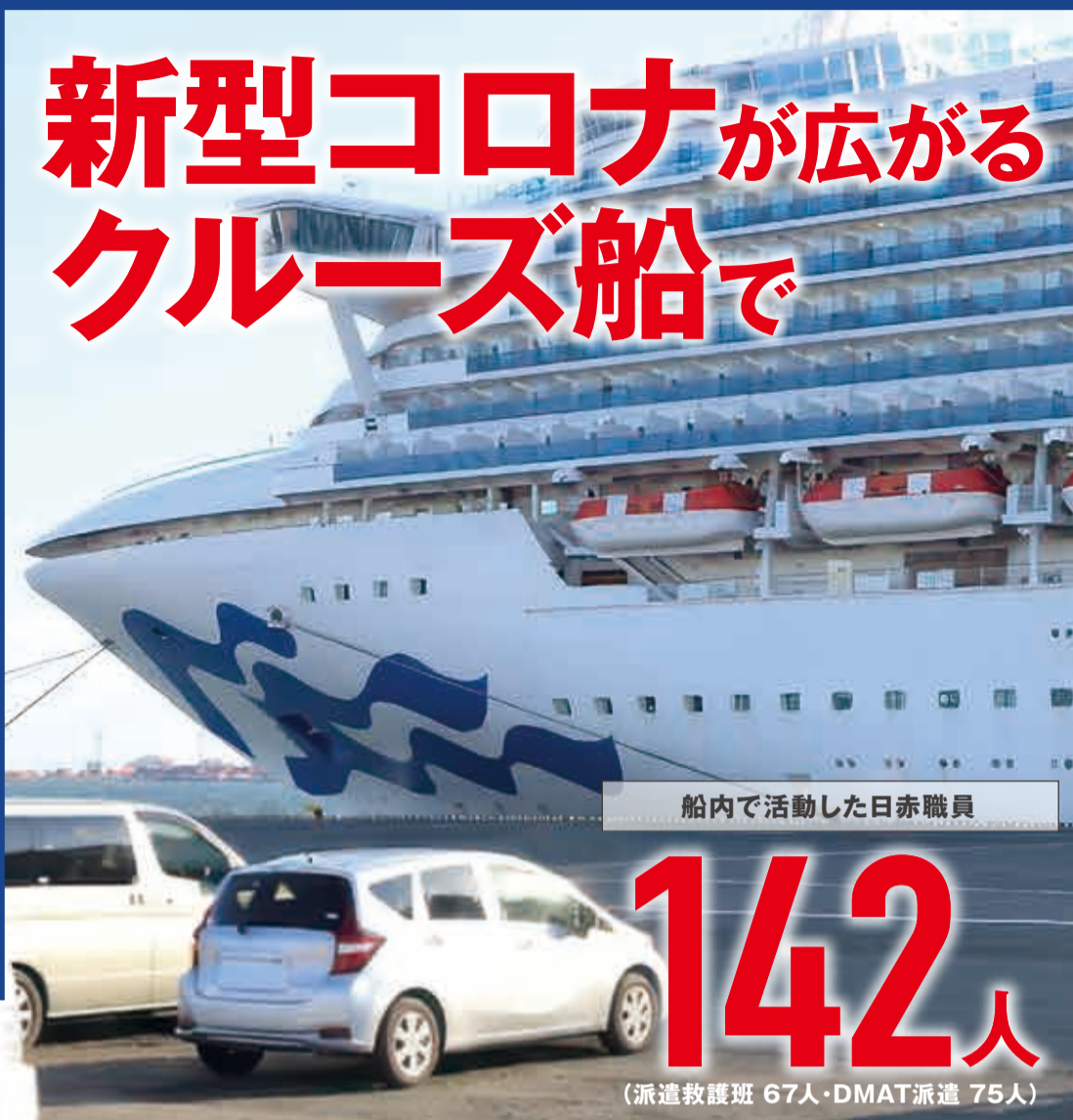
船内で活動した日赤職員