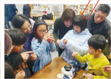
遠心分離機の体験に集まる子どもたち。変化していく様子を、親子でのぞき込むように見つめていました