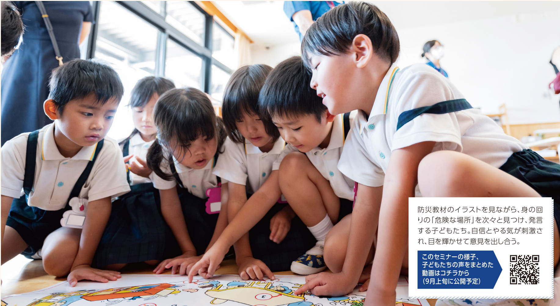
*佐賀県支部では赤十字防災ボランティアが行う防災学習を「防災セミナー」と称しています

日赤は、いつ起こるかわからない大規模災害に備えて、さまざまな人を対象に防災セミナーを行っています。 そのセミナーで講師として活躍するのが、赤十字防災ボランティアです。今回は、佐賀県で実施された幼児向けの防災セミナーに密着。 子どもたちが地震発生時の身の回りに潜む危険に気づき、自分自身と大切な人を守る方法を学んでいく姿を追いました。