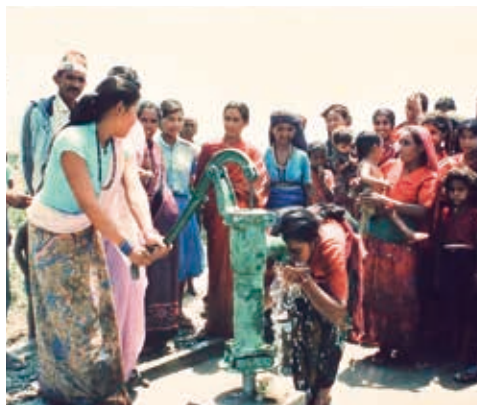
NHK海外たすけあいの寄付によって設置された井戸を喜ぶ村人たち

この事業では、飲料水供給と衛生改善の課題に取り組みました。当時のネパールは、約6人に1人（約18%）の子どもが5歳まで生きられずに亡くなるほど、不衛生な飲料水と衛生知識の欠如による高い罹患率が問題視されていました。日赤はネパール赤十字社を通じて同国の18の郡で人々に安全な水を提供するために、地形の高低を利用した簡易水道や井戸などの整備を進めました。また、保健スタッフが女性向けに保健衛生教育を行ったり、家庭を訪問して食事の栄養バランスを指導したりと、草の根の活動で健康支援を行い、この活動は2003年まで続けました。 現在では、5歳までの子どもの死亡率は2～3%にまで低下。 20年間続いた日赤による支援も、保健衛生の土台作りの一端を担いました。