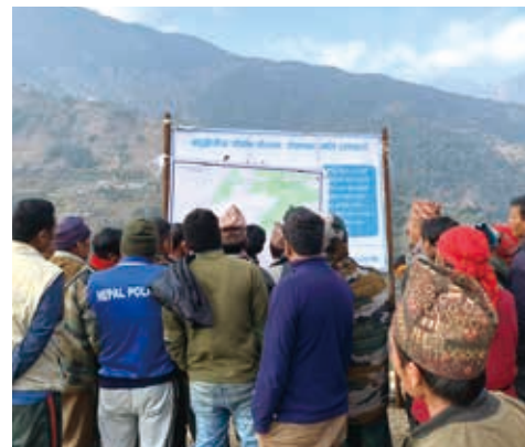
土砂崩れの発生した実際の山を見ながら、議論を交わす自主防災組織のメンバーと村人たち