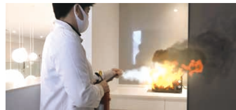
CGで炎や消火剤の白い煙などリアルに演出

大学の協力を得て撮影・編集。授業中に大きな地震があり、校内で火災も発生という想定で、学生目線の対処策を映像化した。屋外の一時避難所にどのルートで避難するか、また、地震により出火した場合の防災設備の使用方法などを、学生メンバーが熟演。