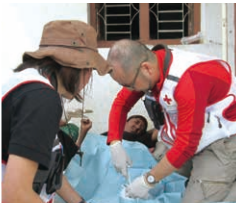
2015年のネパール大地震で被災者のけがの処置をする日赤の医療チーム

支援は区切りを迎えましたが 40年以上の深い関わりの中で強い絆を育み、共に成長してきた「赤十字の仲間」としての連携 は、これからも続いていきます。