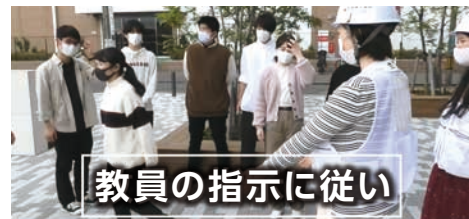
教員の指示に従い