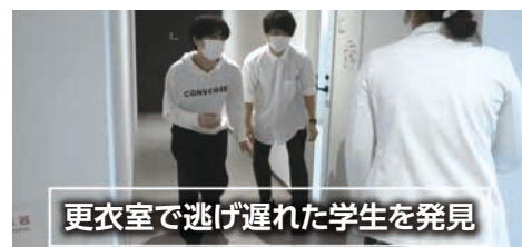
更衣室で逃げ遅れた学生を発見