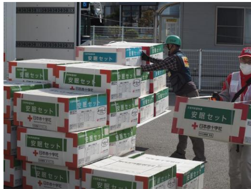
令和7年11月18日大分市佐賀関の大規模火災 において避難所へ救援物資の配布を行う 大分県支部職員とボランティア