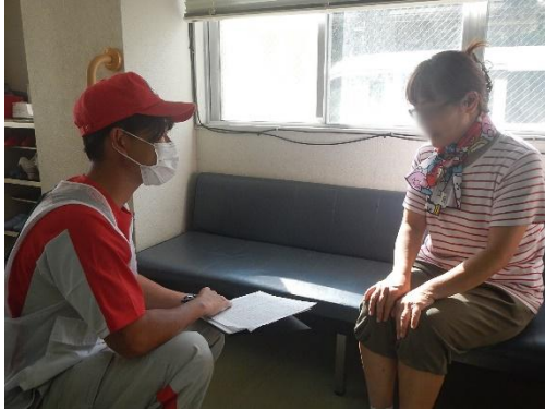
令和7年7月鹿児島十島村付近を震源とする地震において 島民の健康観察を行う鹿児島赤十字病院看護師