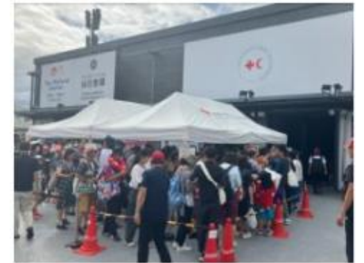
大阪・関西万博への 国際赤十字・赤新月運動パビリオンの出展