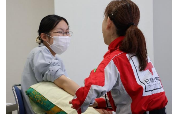
令和7年台風第15号による災害において 牧之原市職員に傾聴とハンドケアを行う 静岡県支部こころのケア要員