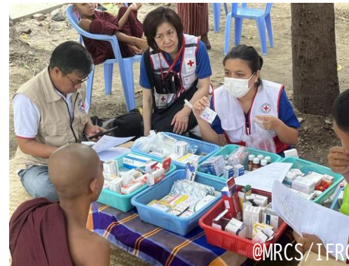
ミャンマー赤十字社が展開する ミャンマー地震被災地域における巡回診療に 帯同する日赤看護師