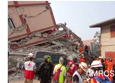
行方不明者の捜索・救助、 負傷者の応急処置等を行 うミャンマー赤十字社スタ ッフ