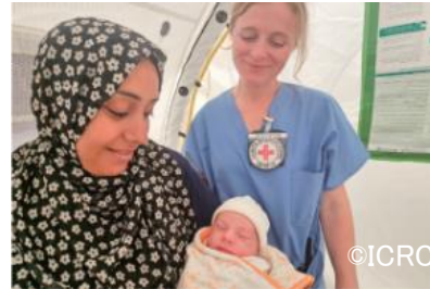
イスラエル・ガザ人道危機に おいて、赤十字国際委員会 が設置した野外病院で誕生 した赤ちゃん