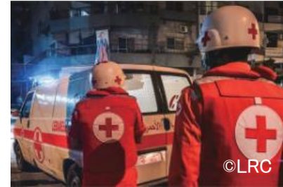
レバノン人道危機において、 負傷者の捜索や救助に出動 するレバノン赤十字社の救 急隊