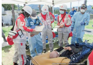
避難者の健康状態を救急隊 に引き継ぐ救護班