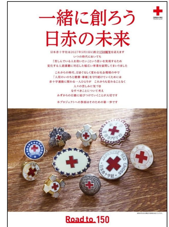
プロジェクトのスローガン