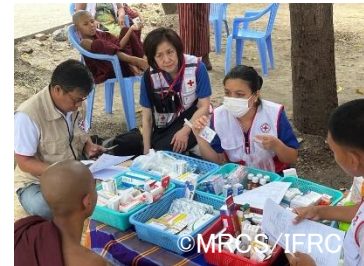
ミャンマー赤十字社が展開 する巡回診療に帯同する 日本赤十字社看護師(写 真中央左)