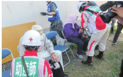
救護班による避難所等への 巡回診療