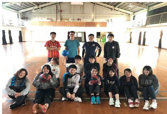
青年奉仕団、その他奉仕団とのスポーツ大会