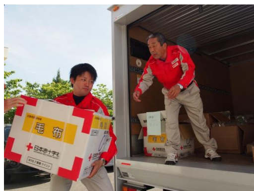
輸送奉仕団と連携し地域への災害支援