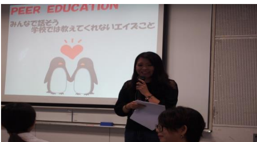
AIDS文化フォーラムin佐賀