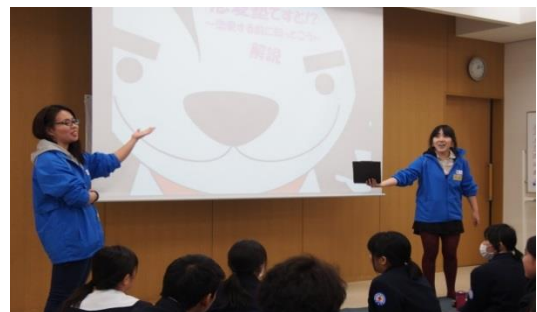
JRC高校生に対するピア・エデュケーション