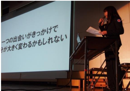
講師として母校で防災講習