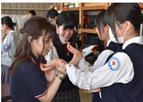
JRC 高校メンバー月別定例会の支援活動