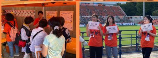
若手ボランティアが活躍！

大学では、看護師を目指して日々学んでおります。 授業内で学び、考えたことを最大限に生かし、団員それぞれが意見交換を行うことで、地域コミュニティの活性化に繋がるボランティアを行っていきたいと思います！