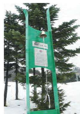
建立されたモニュメントの前で安全なスキーへの誓いを新たにしました

北海道赤十字スキーパトロール誕生50周年を記念して、同記念モニュメントの除幕式が11月27日、小樽市の朝里川温泉スキー場で行われました。