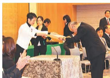
蓮舫内閣特命担当大臣から表彰状が授与されました

子どもたちの健やかな成長を支える活動に顕著な功績があったとして、日本赤十字社が平成23年度「子ども若者育成・子育て支援功労者表彰」を受賞。昨年11月22日に総理官邸で行われた表彰式で、子ども・若者育成支援部門の「内閣府特命担当大臣表彰」を贈られました。