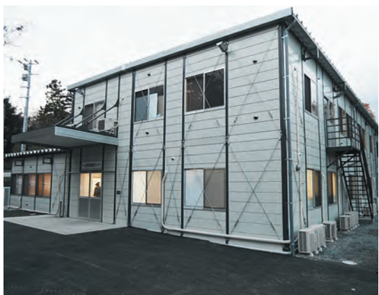
石巻市日和が丘の中央公民館に隣接する仮設急患センター

は2階建ての鉄骨造りで、延べ床面積718平方メートル。診療科目は内科、小児科、外科でCTスキャンや超音波診断装置などの診療設備を備えています。