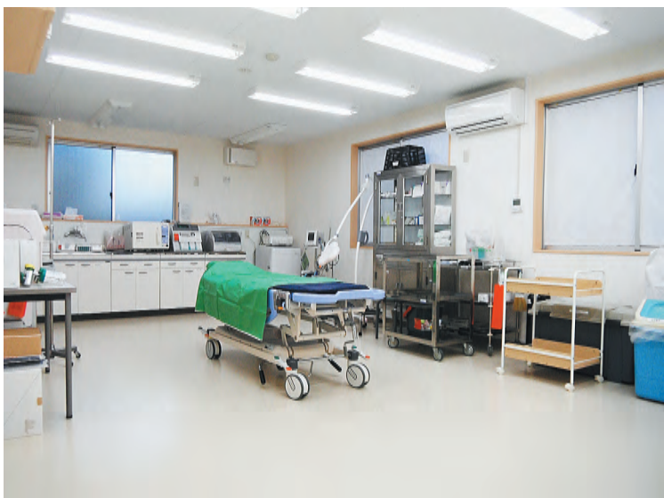
夜間急患センターは主に入院の必要性のない軽度の患者を診察

療復興に不可欠との石巻市や地元医師会からの支援要請を受け、海外救援金を財源に建設を担った日赤が、東日本大震災の津波で1階が冠水。その機能を喪失してしま