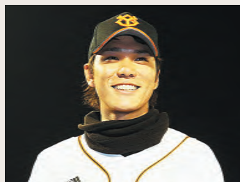
読売ジャイアンツ はやと 坂本勇人選手