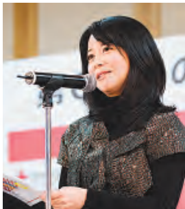
審査員長の 審判を語る 審判員長の 審判を語る

鳥来て 献血車来て 五時限目」と詠み、文部科学大臣賞を受賞。「震災を体験して、自分も何かしたいという気持ちになっていました。献血は最初怖かったけど、やってよかったです」と笑顔で語りました。