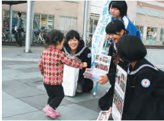
参加した生徒は「呼びかけた人が募金をしてくれたときはすごく嬉しい」と笑顔

地域奉仕団や青年奉仕団、JRC加盟小中高校の生徒など総勢160人が街頭キャンペーンを繰り広げ、JR高松駅前など市内3カ所で募金を呼びかけました。