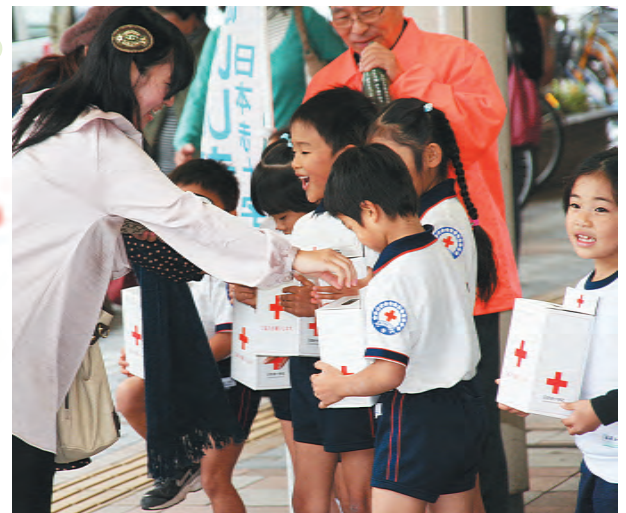
寒さに負けず頑張った江平保育園の園児たち

JRC加盟保育園である江平保育園の園児たちも、寒さを吹き飛ばす半ズボン姿で元気に募金を呼びかけました。