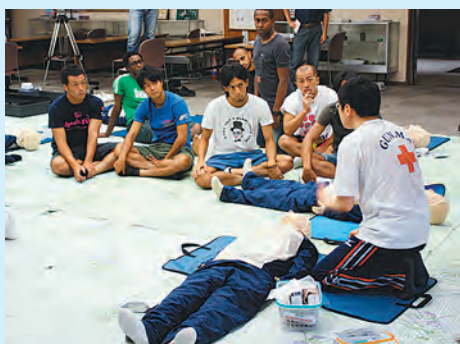
真剣に講習を聞く選手たち