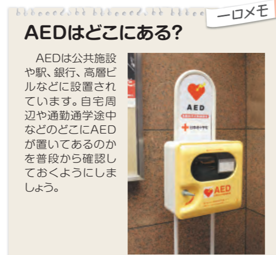
AEDはどこにある? AEDは公共施設や駅、銀行、高層ビルなどに設置されています。自宅周辺や通勤通学途中などのどこにAEDが置いてあるのかを普段から確認しておくようにしましょう。

協力者がいる場合は、その人に119番通報とAEDを依頼します。協力者がいない場合は自分自身で行います。