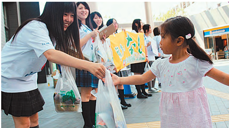
ちゃんと検査しているから安全です

メルマガでは、地域密着の赤十字情報や日赤×AKB48コラボに関するお知らせなどを随時配信しているほか、ここでしか手に入らないオリジナル壁紙のプレゼントも予定しています。また、キャンペーンサイトでは、メンバーのメッセージ動画を順次公開中。サイト訪問者へのメッセージやAED(自動体外式除細動器)体験の感想など、テレビやコンサートとは違ったAKBメンバーの表情が魅力的です。 Webへ