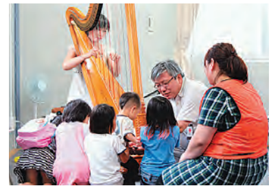
ハープの美しい音色に子どもたちもうっとり