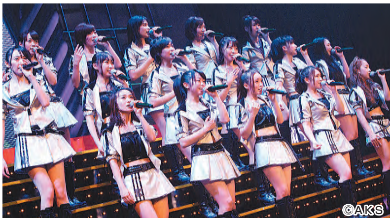
キャンペーンサイトのメッセージ動画は57万回(9月26日現在)の再生が!