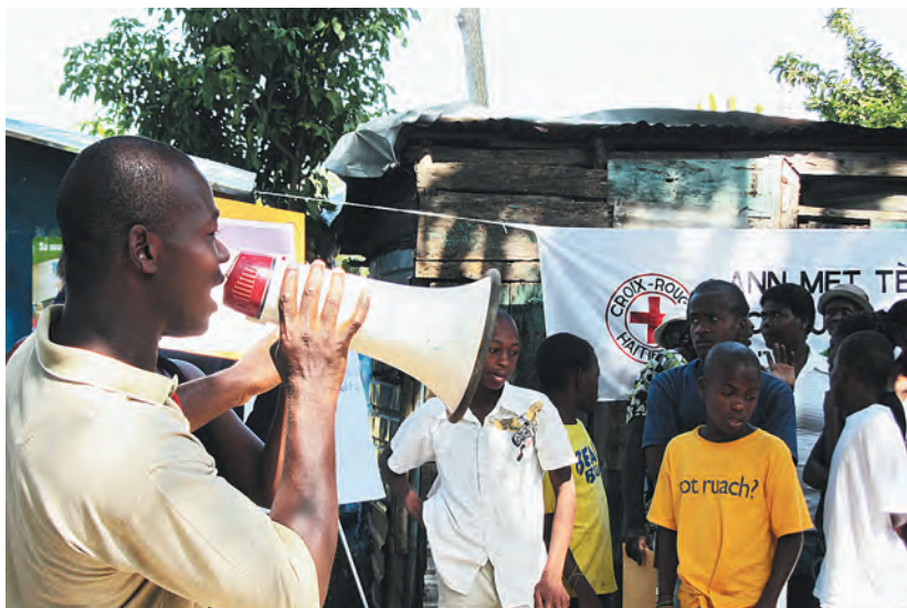
健康講座への参加を村人へ呼びかけるボランティア

ハイチスタッフが「赤十字は、私たちが抱える健康問題を、ボランティアの力で解決していこうと思います」と訴えると、住民から必ず出される意見があります。