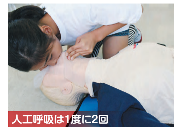
人工呼吸は1度に2回

気道確保のまま、傷病者の鼻をつまみ、自分の口で相手の口を覆うように密着させ、胸が上がるのが分かるまで(約1秒間)息を吹き込みます。いったん口を離して、もう一度繰り返したら、胸骨圧迫を行います。