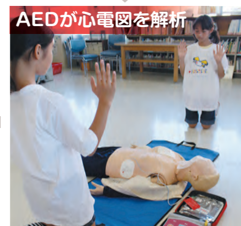
AEDが心電図を解析 電極パッドを貼るとAEDが自動的に心電図解析を始めるので、心肺蘇生法を中止し、周囲の人にも1mくらい離れてもらいます。「ショックが必要です」の音声指示が出ると自動的に充電がスタート。「ショックは不要です」の音声指示の際は、直ちに心肺蘇生法を再開します。