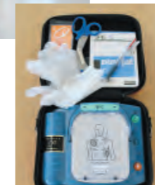
AEDの中には、人工呼吸時の感染予防用フェイスシート、水気などを拭き取るタオル、着衣切断用のはさみなども入っています。