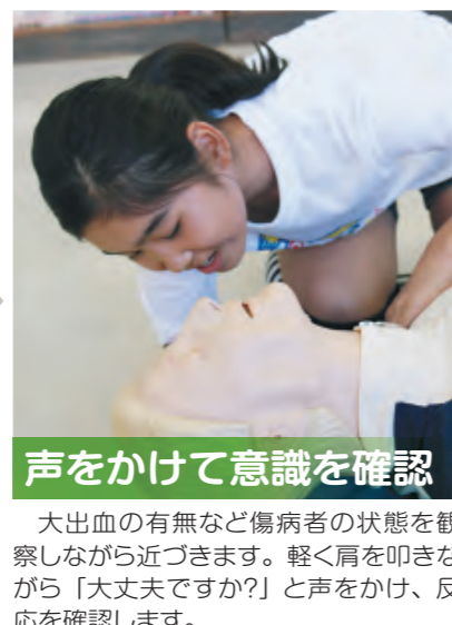
声をかけて意識を確認 大出血の有無など傷病者の状態を観察しながら近づきます。軽く肩を叩きながら「大丈夫ですか?」と声をかけ、反応を確認します。