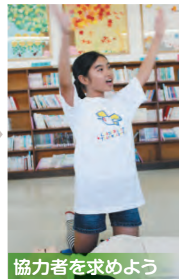
協力を求めよう 「誰か助けてください」など、周囲の人に救助の手伝いを求めます。