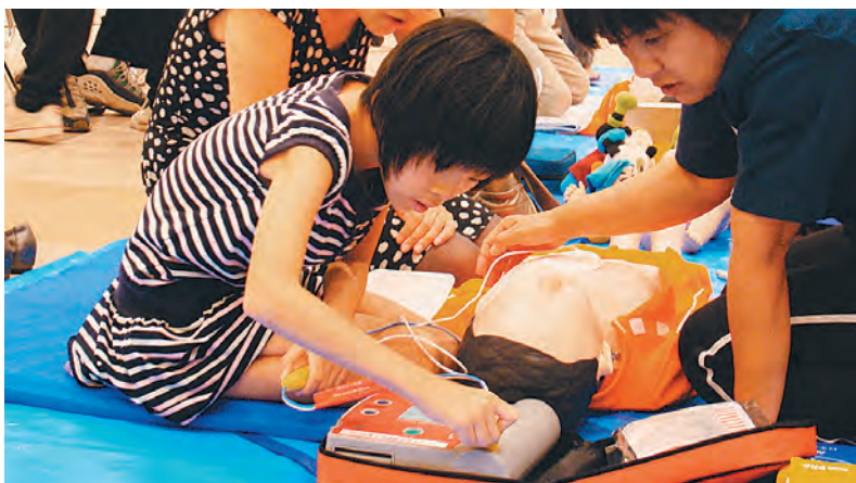
愛媛県支部は大型ショッピングセンターを会場にAED体験などを実施

親子で参加できる教室を開催したのは福岡県支部。「親子でチャレンジ救急法体験」には、10組の小学生と保護者が参加しました。同時に開催された「子育て支援講習会」では幼児がのどに物を詰ませたときの対処法についても学