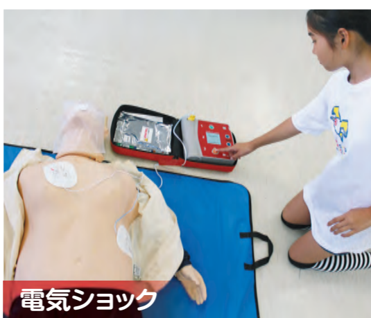
電気ショック 充電が完了するとAEDから電気ショックの指示が出されます。傷病者に誰も触れていないことを確認して、ショックボタンを押します。電気ショック後は直ちに心肺蘇生法を再開します。2分後に再び心電図解析が始まるので、音声指示に従って、電気ショックあるいは心肺蘇生法を繰り返します。