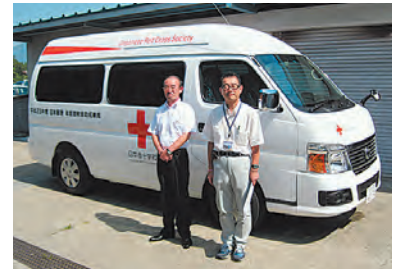
福祉車両は、宮古市、釜石市、大船渡市、陸前高田市、大槌町の5カ所に配置