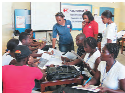
ボランティアを対象にした研修では、住民への上手な伝え方についても学ぶ

病院)は「家庭訪問をしたボランティアが、栄養不良の乳児を救った事例も報告されています」と顔をほころばせます。