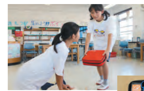
電源を入れる 協力者からAEDを受け取ったら、すぐに電源ボタンを押して、電源を入れます。機種によっては、ふたを開けると自動的に電源が入るタイプもあります。電源が入ると自動的に音声案内が始まります。AEDを準備している間も心肺蘇生法が中断がないよう、協力者に心肺蘇生法を交差し、継続するようにしてください。