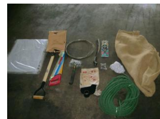
シェルターキット