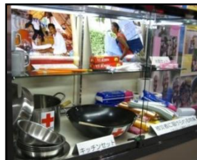
台所セットと衛生セット