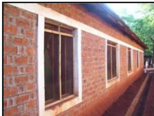
診療所に蚊帳を設置。 マラリアを防ぐ(ルグフ・キャンプ)