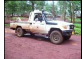
医薬品等を移送する車両