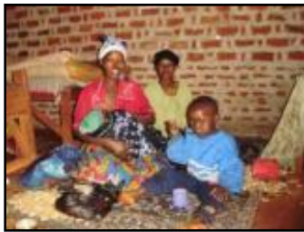
治療用補助給食の提供 (ムタビラ・キャンプ)