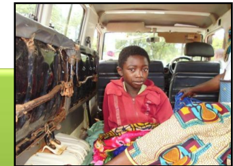
搬送される男の子