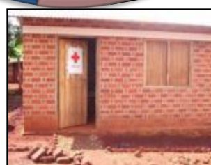
経口補水塩センターの建設 (ムタビラ・キャンプ)