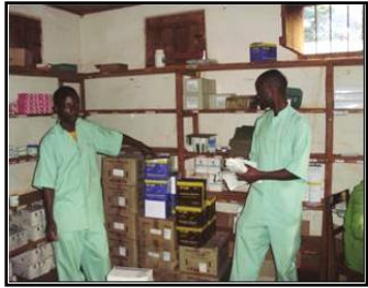
難民キャンプの薬局倉庫