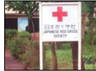
日本赤十字社からの支援を示す 看板設置(ムタビラ・キャンプ)