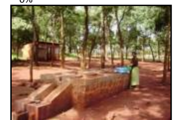
洗いの設置(ムタビラ・キャンプ)