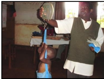
治療用補助給食センターでの 発育測定(ムタビラ・キャンプ)