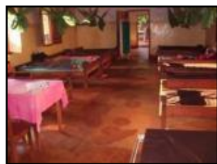
病棟の床を修繕 (ニャルグス・キャンプの病院内)