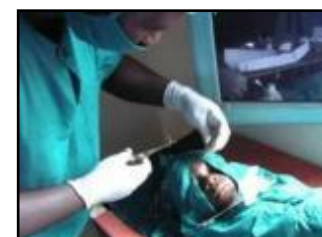
簡易外科手術室の設置 (ムタビラ・キャンプ)